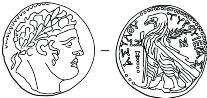
Rysunek 2. Srebrny szekel z Tyr (120–119 przed Chr.). Autor: Eugenio Alliaia

tetradrachmyz Antiochiii Cezarei Kapadockiej oraz szekla bitego w Tyrze (126 przed Chr. – 56 po Chr.) 52 .