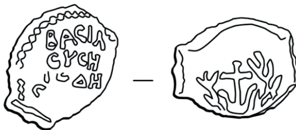
Rysunek 4. Prutah Heroda Wielkiego (37–4 przed Chr.). Autor: Eugenio Alliaata

Z drugiej strony Łukasz, piszący do wspólnoty języka greckiego, nie musiał borykać się z tym samym problemem. Λεπτόν nie tylko była używana w Palestynie czasów Jezusa, ale także stanowiła najmniejszą monetę greckiego systemu monetarnego. W przypadku, gdyby ktoś z obiorców jego Ewangelii nie znał tego systemu (jest to niemalże nieprawdopodobne), zrozumienie ewangelicznego przekazu nie powinno stanowić jakiegokolwiek przeszkody dla posługujących się językiem greckim na co dzień. Grecka nazwa monety λεπτόν dawała jasno do zrozumienia, że chodzi o coś niezwykle małego, niemającego znaczącej wartości materialnej.