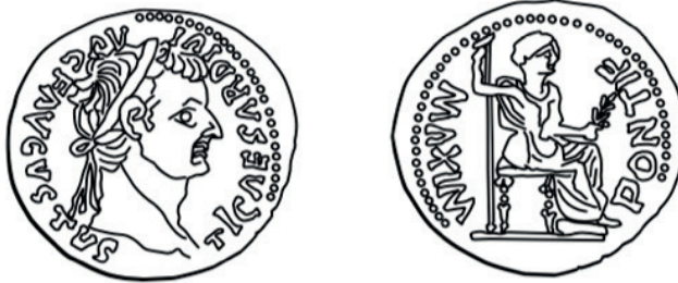
Rysunek 1. Srebrny denar Tyberiusza (14–37 po Chr.). Autor: Eugenio Alliata

Odpowiadając na podchwytliwe pytanie faryzeuszów i zwolenników Heroda, „czy należy płacić podatki”, Jezus polecił im przynieść monetę, po czym zwrócił się do nich mówiąc: „czyja to podobizna i napis? Oni mu odpowiedzieli: Cezara” (Mk 12,16). Z pytania o podobiznę i napis, jak i z udzielonej odpowiedzi można wnioskować, że chodziło o monetę rzymską okresu imperium. Na monetach tych, oprócz podobizny władcy, znajdowała się także legenda dotycząca przedstawionej osoby. Skomplikowana jest kwestia, czy chodziło o Juliusza Cezara (zm. 44 przed Chr.), Oktawiana Augusta (27 przed Chr. – 14 po Chr.), czy też panującego w czasach Jezusa cesarza Tyberiusza (14–37 po Chr.). Nie można całkowicie wykluczyć, że chodziło o Cezara, który jako pierwszy spośród władców Rzymu bił monety ze swoim wizerunkiem, co przemawiałoby za faktem, że podana Jezusowi moneta przedstawiała właśnie jego. Zdaje się to potwierdzać udzielona odpowiedź – Καίσαρος. Należy jednak pamiętać, że oprócz imienia własnego, termin ten odnosi się także do tytułu, jaki nosili późniejsi imperatorzy rzymscy. Co więcej, niewielka liczba monet imperialnych z I wieku przed Chr., jaka została odnaleziona w Palestynie, zdaje się wykluczać monety Juliusza Cezara 16 .