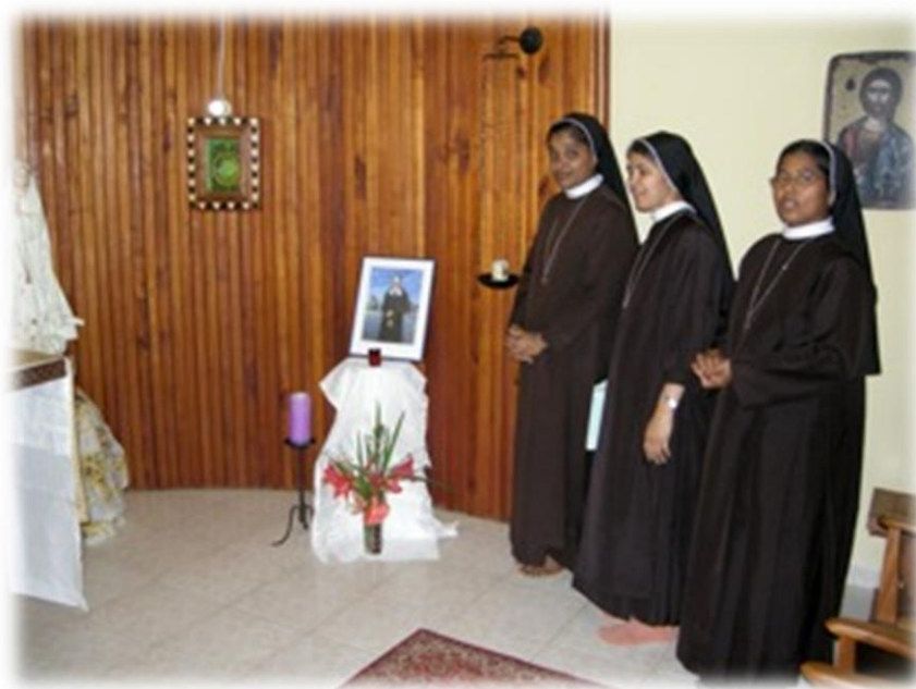
Ilustracja 11 Rwanda. Uroczyste przywitanie relikwii bł. Marii Euthymii Üffing.