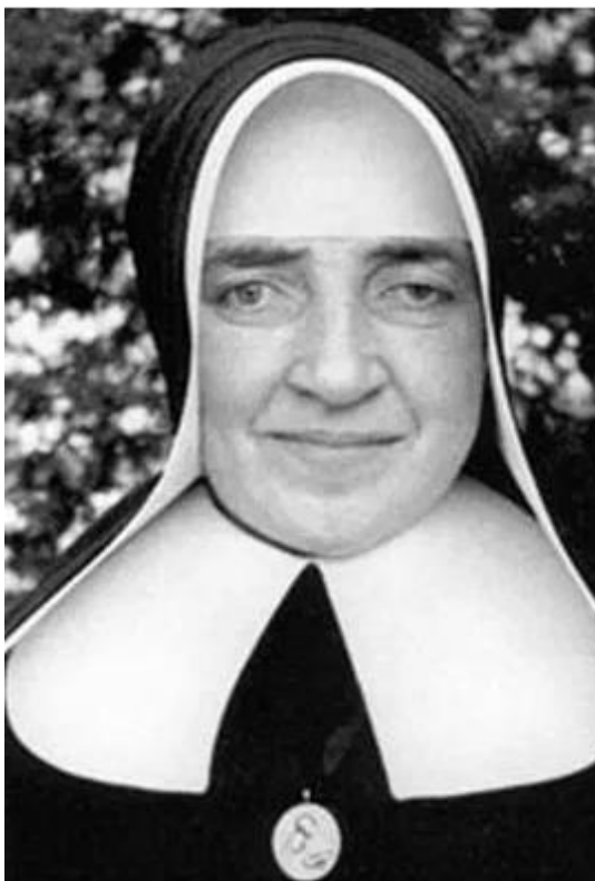
Ilustracja III.1 Siostra Maria Euthymia Üffing