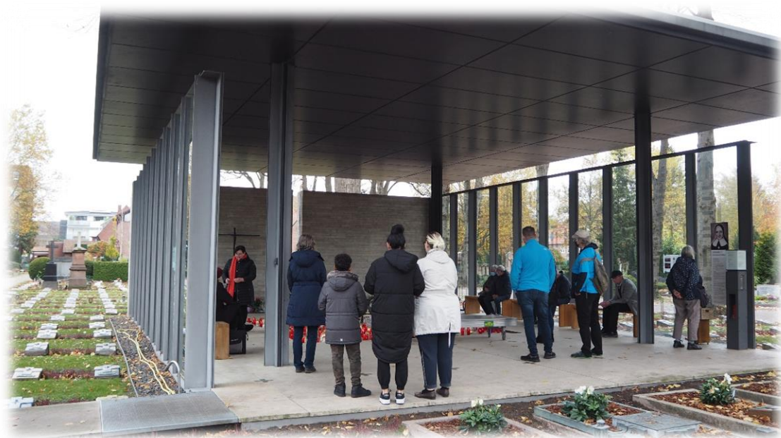
Ilustracja 32 Kaplica cmentarna poświęcona pamięci bł. siostry Marii Euthymii Üffing. Cmentarz centralny w Münster.