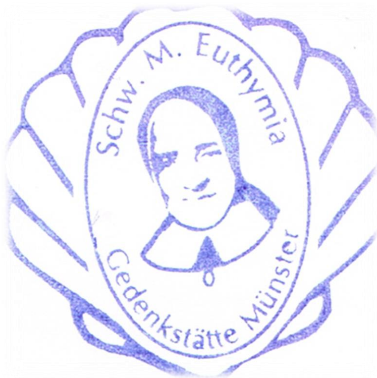
Ilustracja 34 Pieczątka pielgrzymia z Domu Macierzystego Sióstr św. Klemensa w Münster.