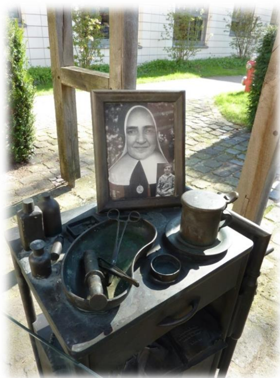
Ilustracja 26 Szafka przyłóżkowa szpitalna wraz z narzędziami chirurgicznymi oraz zabiegowymi w baraku św. Barbary w Dinslaken.