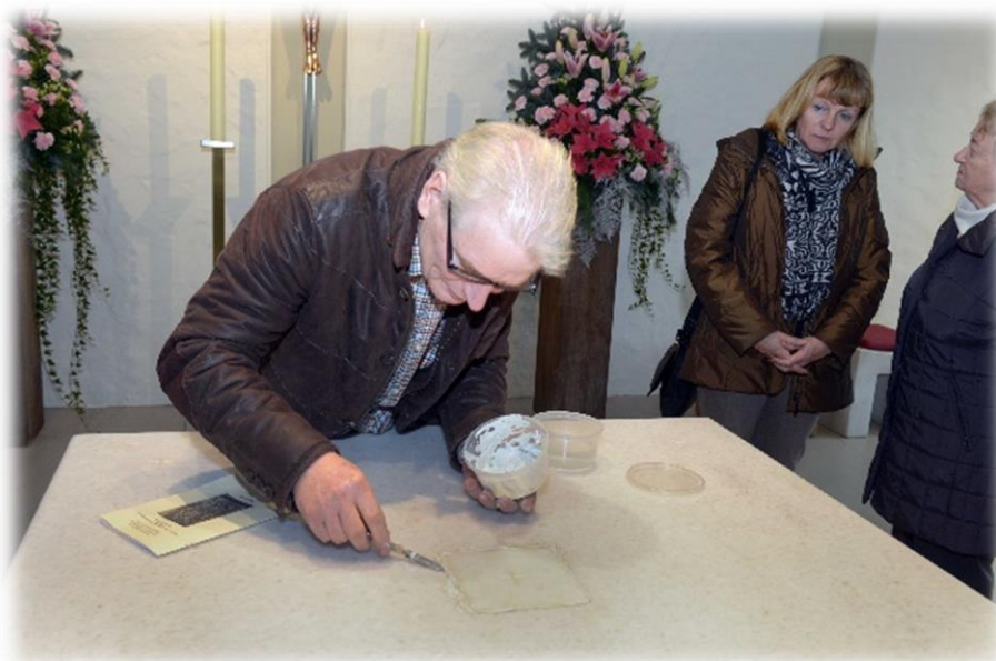
Ilustracja 5 Wmurowanie relikwii bł. Siostry Euthymii Üffing w kaplicy szpitalnej w Werne.