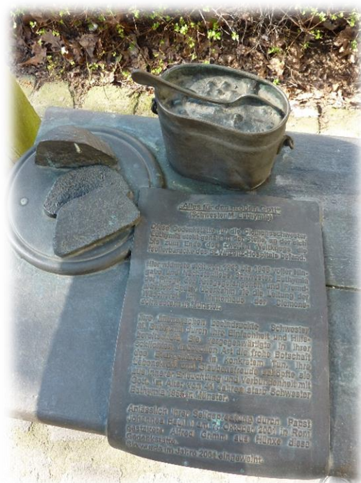
Ilustracja 25 Wojskowa menażka, chleb oraz tablica informacyjna o „Baraku św. Barbary” w formie listu.