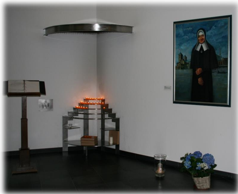
Ilustracja 15 Centrum Euthymia. Miejsce modlitewne pamięci z księgą próśb do bł. Siostry Marii Euthymii.