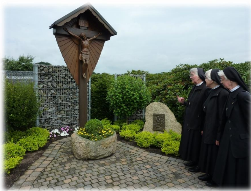
Ilustracja 31 Szlak Pamięci Siostry Marii Euthymii Üffing w rodzinnej miejscowości Halverde. Składa się z 6 stacji, trasa około 1,5 km długości, na stacjach jest kilka miejsc siedzących. Szlak pamiątkowy przystosowany jest dla osób na wózkach inwalidzkich.