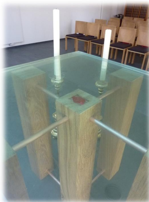
Ilustracja 17 Zainstalowanie relikwii bł. Siostry Marii Euthymii Üffing w kaplicy szpitalnej w Sassenberg. Ołtarz.