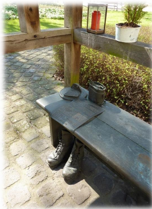
Ilustracja 24 Symboliczna wojskowa menażka, chleb oraz buty wojskowe w baraku świętej Barbary w Dinslaken.