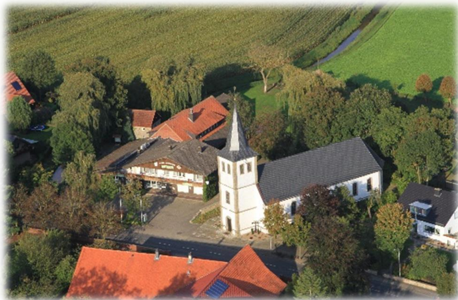
Ilustracja 12 Kościół św. Piotra i Pawła w Halverde, widok z lotu ptaka. Świątynia parafialna bł. Siostry Marii Euthymii Üffing.