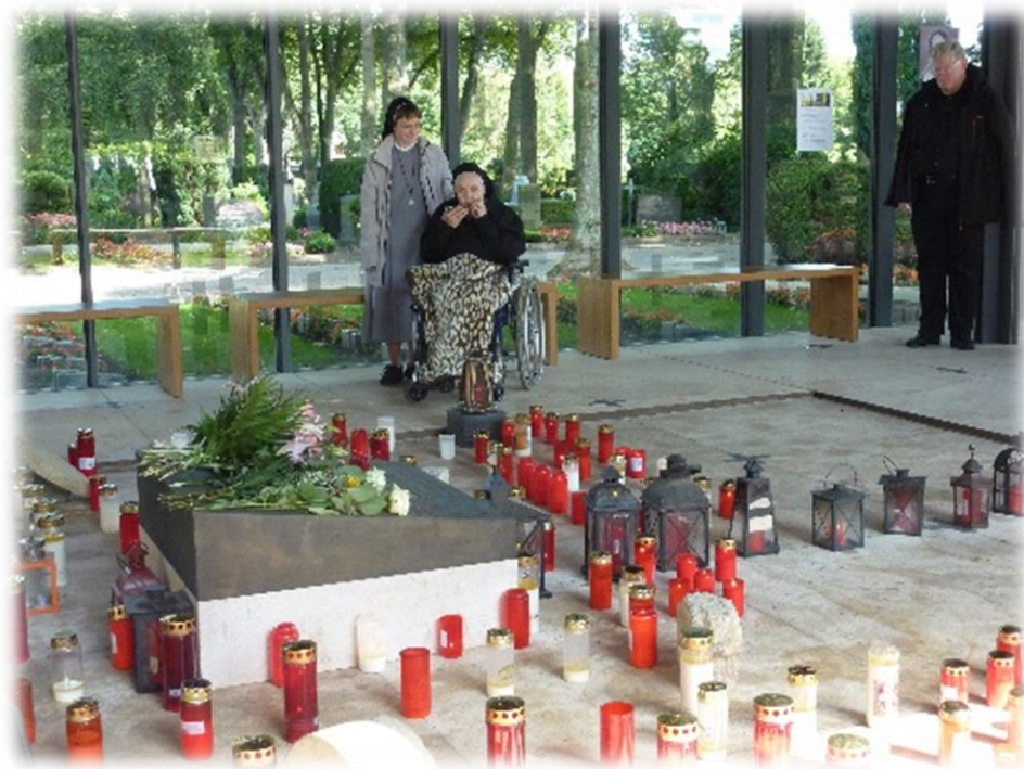
Ilustracja 2 Nagrobek bł. Siostry Euthymia Üffing – Cmentarz Centralny (Zentralfriedhof) Münster.

Źródło: Archiwum Sióstr św. Klemensa, Dom Macierzysty, Klosterstraße 85, 48143 Münster.