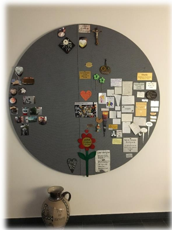
Ilustracja 14 Centrum Euthymia. Tablica modlitewna w kształcie kuli ziemskiej.