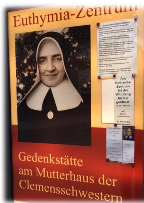
Ilustracja 3 Tablica informacyjna przed Domem Macierzystym Sióstr Świętego Klemensa w Münster.