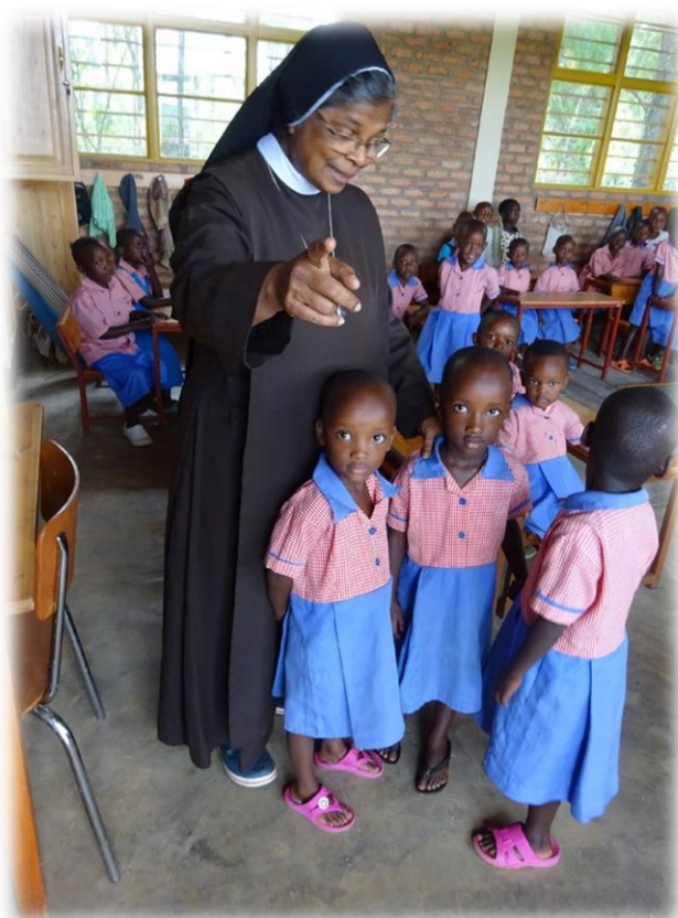
Ilustracja 7 Sierociniec prowadzony przez Siostry św. Klemensa, Rwanda – Kaduha.