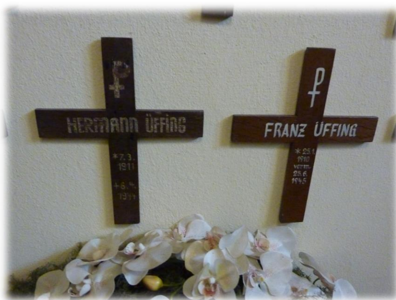
Ilustracja 27 Symboliczne krzyże nagrobkowe rodzonych braci Eythymii Üffing. Obaj polegli podczas II Wojny Światowej. Miejsce pamięci znajduje się w kościele parafialnym świętego Piotra i Pawła w Halverde.