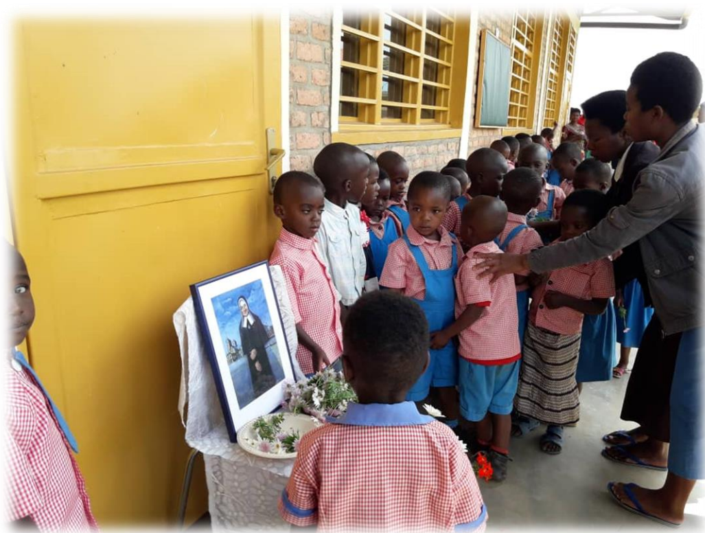
Ilustracja 33 Wprowadzenie relikwii bł. siostry Euthymii Üffing w Domu Dziecka, Rwanda - Kaduha - 15 IV 2016 r.