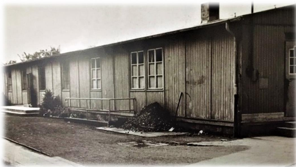
Ilustracja 6 Barak św. Barbary w czasach Drugiej Wojny Światowej.