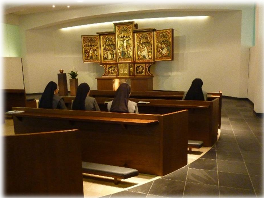
Ilustracja 19 Kaplica w domu macierzystym Sióstr św. Klemensa.