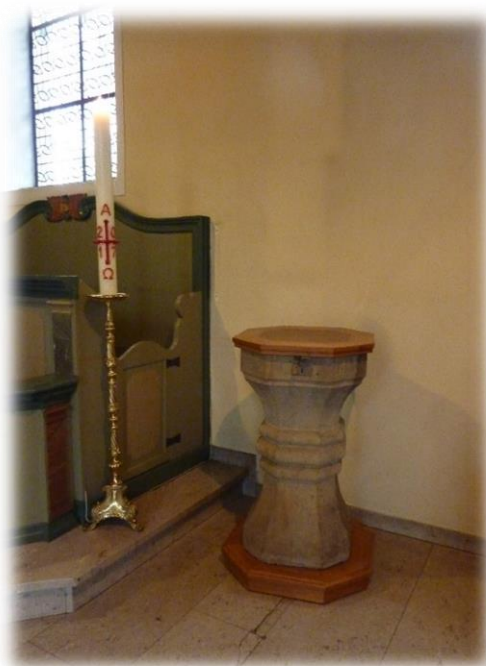
Ilustracja 30 Chrzcielnica w kościele św. Piotra i Pawła w Halverde przy której Euthymia Üffing otrzymała sakrament chrztu świętego.