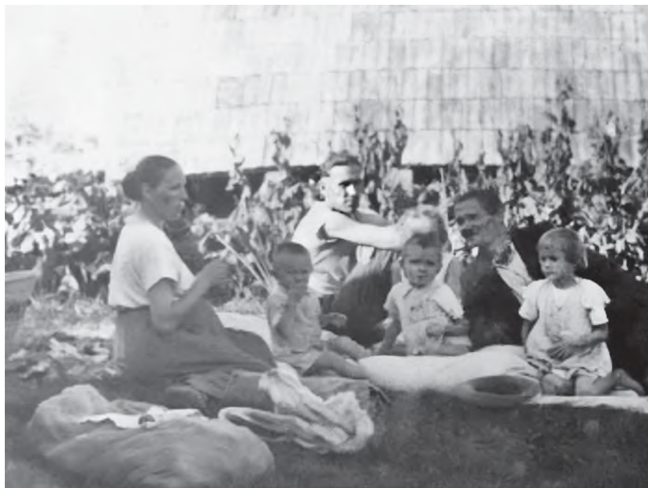
Fot. 4. Rodzina Ulmów z dziećmi

„Ulmowie bronili życia za cenę życia” 4 – podkreślił kard. Konrad Krajewski, jałmużnik papieża Franciszka, w pewnym sensie współczesny Samaritanin, zwracając uwagę na pełne przyłgnięcie Ulmów do słów Ewangelii.