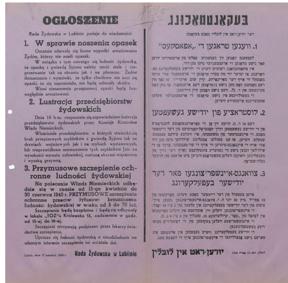
Fot. 26. Ogłoszenia w sprawie noszenia opasek, lustracji przedsiębiorstw żydowskich i przymusowych szczepień, Lublin, 12 kwietnia 1940 roku

Od początku wojny, aby odizolować Żydów od reszty ludności, Niemcy tworzyli getta. Pierwsze getto w okupowanej Polsce powstało w październiku 1939 roku w Piotrkowie Trybunalskim, jakoby z konieczności ochrony pozostałych mieszkańców przed chorobami zakaźnymi. Dlatego przy wejściach do gett lub dzielnic, w których mieszkali Żydzi, okupanci umieszczali tabliczki w języku polskim i niemieckim z napisem: „Teren zagrożony tyfusem”. Szacuje się, że w okupowanej Polsce Niemcy utworzyli ponad 500 gett dla Żydów. Największym z nich było getto w Warszawie, gdzie na niewielkiej przestrzeni