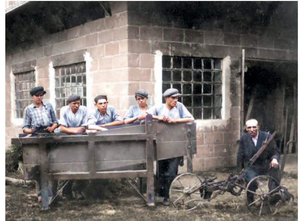
Fot. 31. Mieszkańcy Markowej przed kuźnią

praw pracowniczych. Istotne znaczenie miała również decyzja o powszechnej ochronie zdrowia, a także utworzenie pierwszej ubezpieczalni.