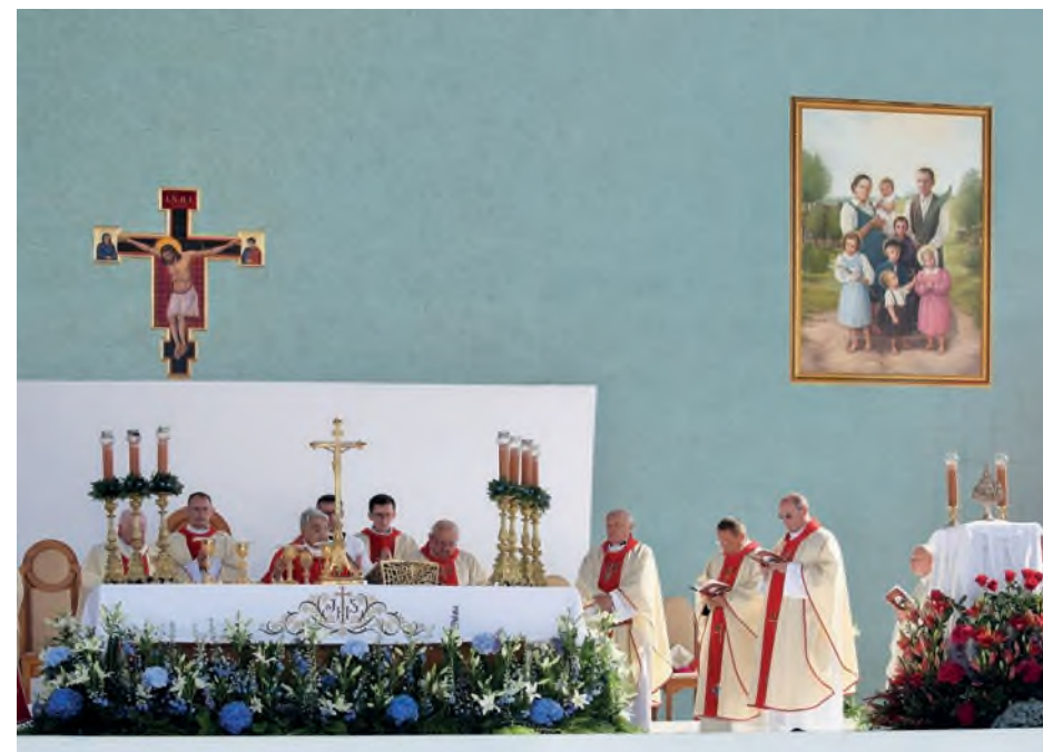
Fot. 47. Beatyfikacja rodziny Ulmów w Markowej 10 września 2023 roku

Nowi Błogosławieni uczą nas przede wszystkim przyjmowania Słowa Bożego i codziennego dążenia do pełnienia woli Bożej. Ulmowie jako rodzina słuchali tego Słowa Bożego w niedzielnej liturgii, a następnie kontynuowali jego medytację w domu, co widać w czytanej i podkreślanej przez nich Biblii. Jak już wspominałem, bardzo znaczące jest słowo „tak” odręcznie napisane przy przypowieści o miłosiernym Samarytaninie, a także podkreślenie zdania, w którym Jezus wzywa do miłowania nawet własnych nieprzyjaciół (Mt 5,46). W ten sposób wysłuchane Słowo Pana, dzień po dniu kształtowało ich odważny program życia.