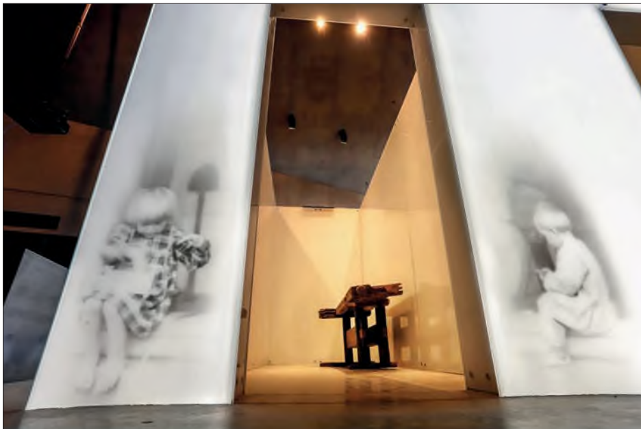
Fot. 50. Muzeum Polaków Ratujących Żydów podczas II wojny światowej im. Rodziny Ulmów w Markowej – frontowa ściana symbolicznego domu rodziny Ulmów