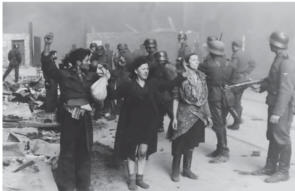
Fot. 28. Zdjęcie zrobione przy ulicy Nowolipie w Warszawie pomiędzy 19 kwietnia a 16 maja 1943 roku. Z tyłu mur i brama getta

Biskupi, księża i osoby zakonne były bardzo aktywne w niesieniu pomocy ludności żydowskiej. Jak wskazują najnowsze badania, ponad 2,5 tys. sióstr, ojców i braci zakonnych z około 100 zakonów w ponad 500 domach zakonnych pomagało ludności żydowskiej. Ponadto ponad 700 księży diecezjalnych w 600 miejscowościach w całym kraju w dramatycznych latach Holokaustu udzielało wsparcia Żydom 33 . Warto powiedzieć, że był to najtrudniejszy okres prześladowań Kościoła katolickiego w Polsce. Niemieccy naziści wysłali około 50% księży diecezjalnych do obozów koncentracyjnych, wysiedlali ich lub w inny sposób uniemożliwiali im posługę duszpasterską. Łącznie około 20% z nich zostało zamordowanych.