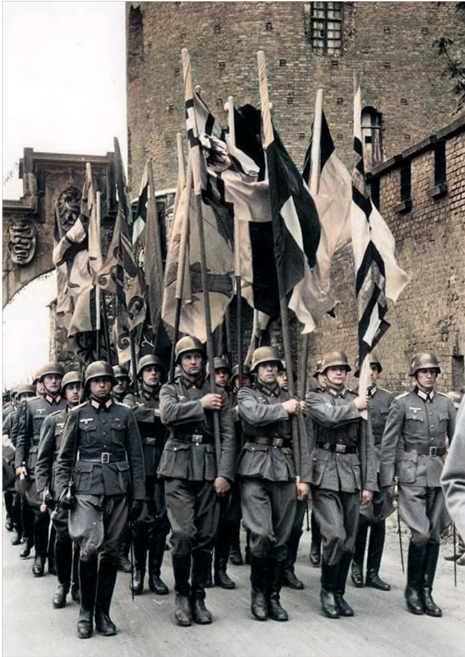
Fot. 25. Parada żołnierzy Wehrmachtu na Wawelu w okupowanej Polsce w 1940 roku

W październiku 1939 roku Niemcy dokonali podziału okupowanego terytorium Polski. Tereny graniczące z Niemcami, które należały do państwa niemieckiego przed I wojną światową, oraz te, które były rozwinięte gospodarczo, zostały włączone do III Rzeszy. Na pozostałych ziemiach utworzono Generalne Gubernatorstwo, na którego czele stanął rezydujący w Krakowie Hans Frank.