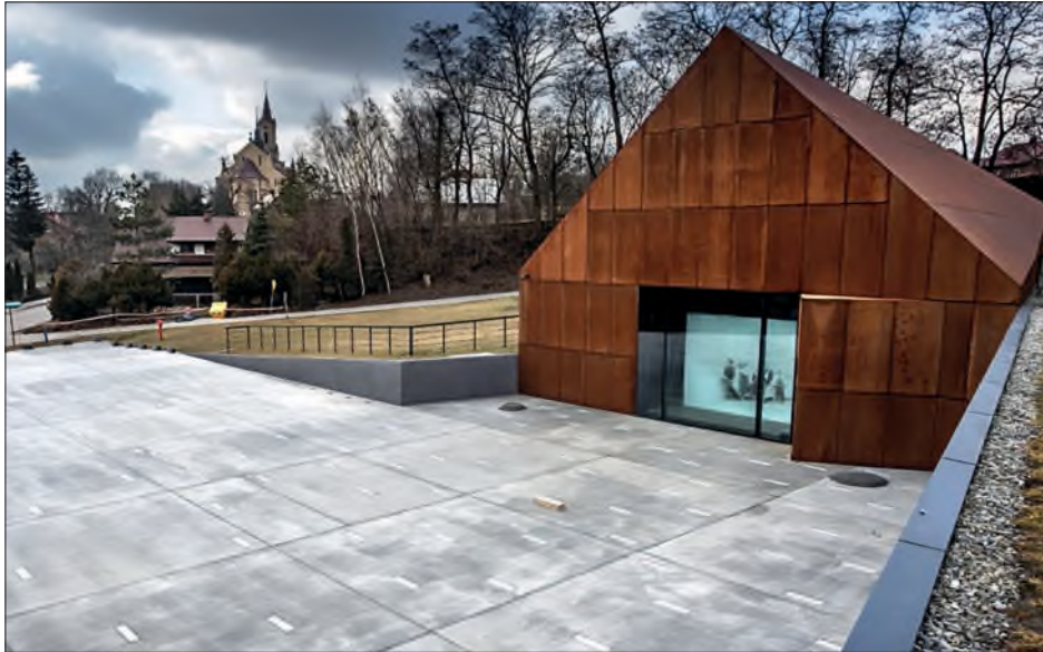
Fot. 49. Muzeum Polaków Ratujących Żydów podczas II wojny światowej im. Rodziny Ulmów w Markowej