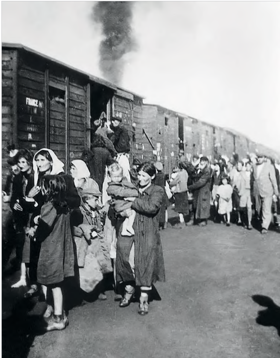
Fot. 27. Deportacja polskich Żydów z Siedlec do Treblinka w 1942 roku

W ramach operacji „Reinhardt” 17 marca 1942 roku z lubelskiego getta wyruszyły pierwsze transporty Żydów do obozu zagłady w Sobiborze. Natomiast do obozu zagłady Treblinka II pierwszy transport wyjechał 22 lipca 1942 roku. Byli to Żydzi z warszawskiego getta. Do niemieckich obozów zagłady rozmieszczonych na terytorium okupowanej Polski wywożono Żydów nie tylko z gett znajdujących się w Polsce, ale też w innych częściach Europy.