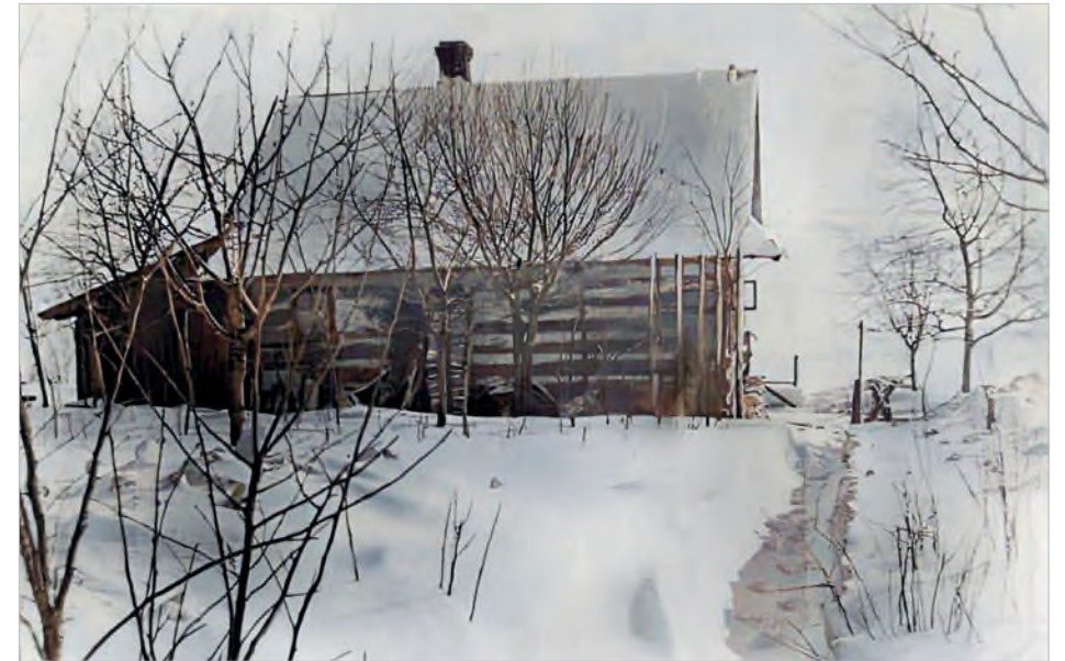
Fot. 23. Dom rodziny Ulmów wybudowany przez Józefa w latach trzydziestych XX wieku, o konstrukcji drewnianej, z dwuspadowym dachem pokrytym dachówką

strony nazistów prawdopodobnie ukrywały się wraz z rodzicami w pobliskich miejscowościach. Żadna z nich nie przeżyła Holokaustu 14 .