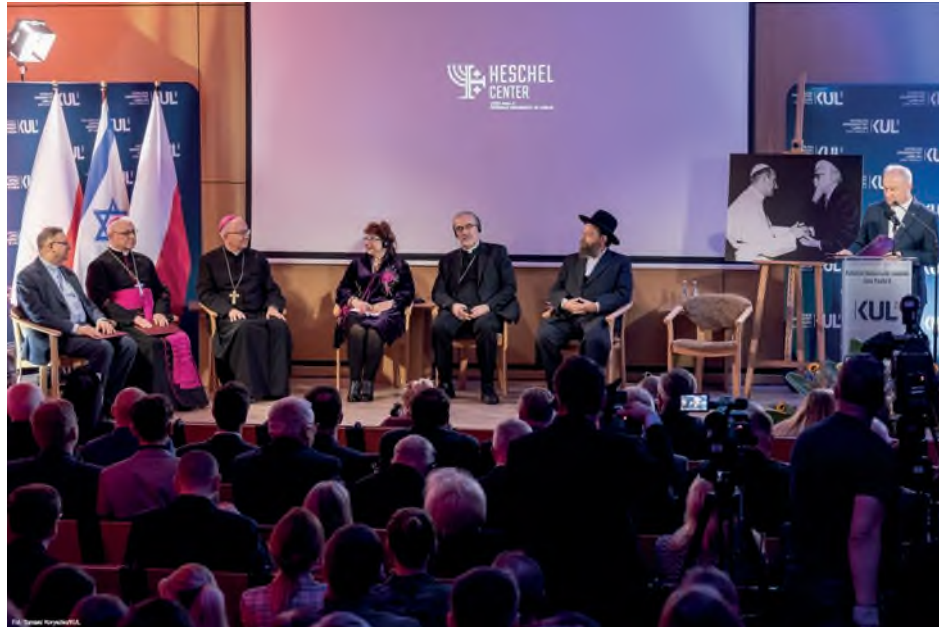
Fot. 51. Inauguracja Centrum Relacji Katolicko-Żydowskich KUL im. Abrahama J. Heschela na Katolickim Uniwersytecie Lubelskim Jana Pawła II