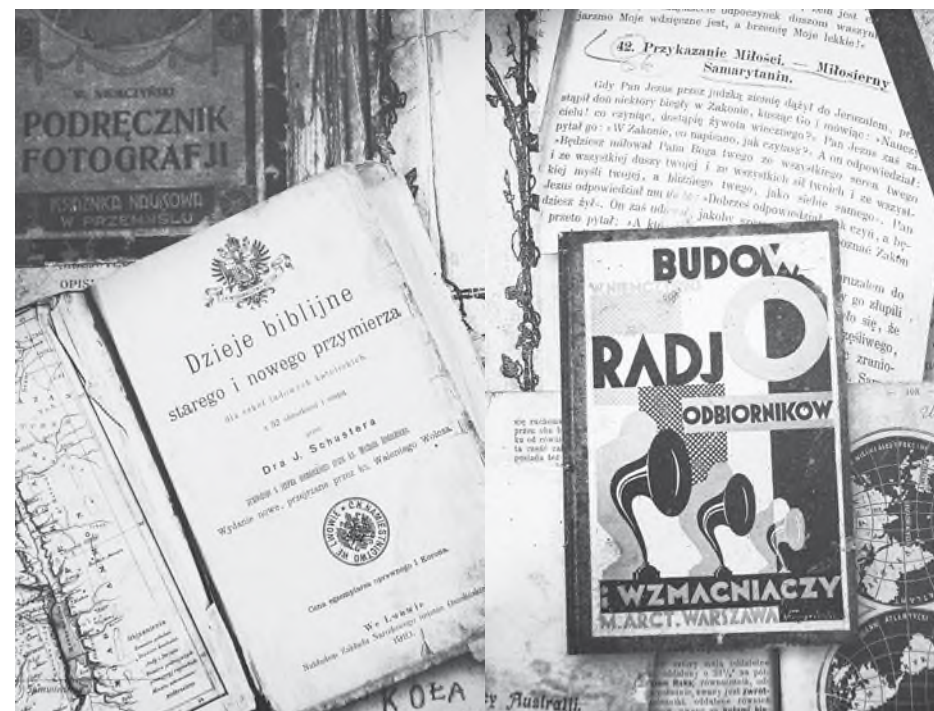
Fot. 8. Wybrane książki z biblioteczki Józefa Ulmy. Tytuły z wielu dziedzin świadczą o jego wszechstronnych zainteresowaniach. Korzystając z fachowych książek i czasopism, Józef zbudował aparat fotograficzny, proste radio oraz niewielki przydomowy wiatrak

W Biblii Ulmów znalezionej w domu w Markowej już po ich śmierci szczególną uwagę zwracają dwa podkreślone czerwoną kredką ustępy. Pierwszy to słowa z piątego rozdziału Ewangelii św. Mateusza, ze słynnego