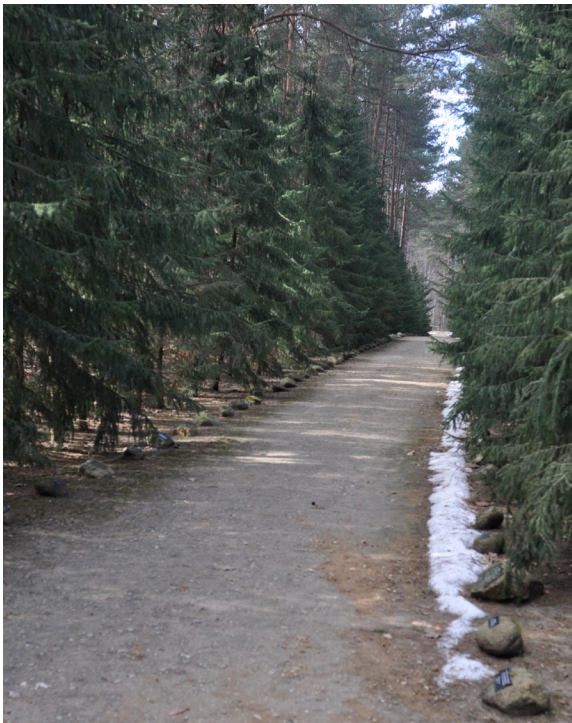
2. Muzeum i Miejsce Pamięci w Sobiborze, Aleja Pamięci , 2003