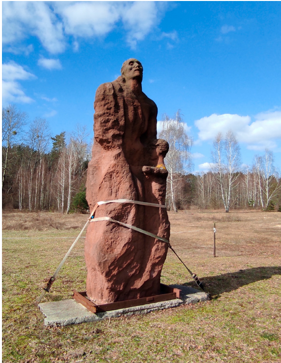
1. Muzeum i Miejsce Pamięci w Sobiborze, Mieczysław Welter, pomnik matki-więźniarki z dzieckiem (druga wersja pomnika), czerwony piaskowiec, 1977