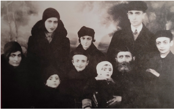
9. Muzeum i Miejsce Pamięci w Sobiborze, reprodukcje fotografii prezentowane na wystawie stałej

8. Museum and Memorial Site in Sobibór, objects in the display case of the permanent exhibition