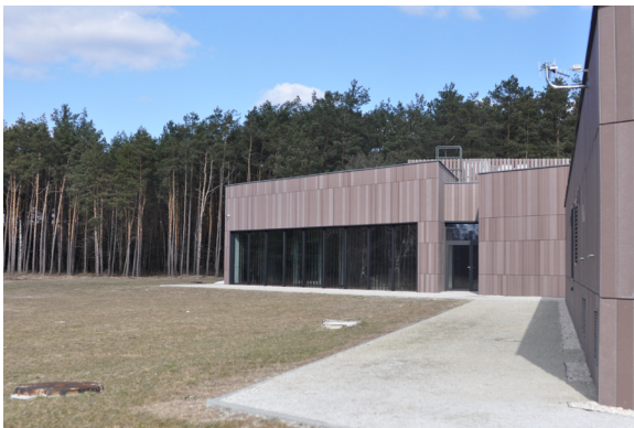
6. Muzeum i Miejsce Pamięci w Sobiborze, budynek muzeum 6. Museum and Memorial Site in Sobibór, Museum building

ucieczką, oraz na las – schronienie szczęśliwej grupy uciekinierów. Odmienne zaprojektowano perspektywę widokową z okien ściany północnej – tu widok zostanie zasłonięty betonową ścianą, wyznaczającą drogę kaźni pomordowanych 34 .