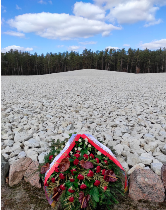
4. Muzeum i Miejsce Pamięci w Sobiborze, miejsce masowych mogił