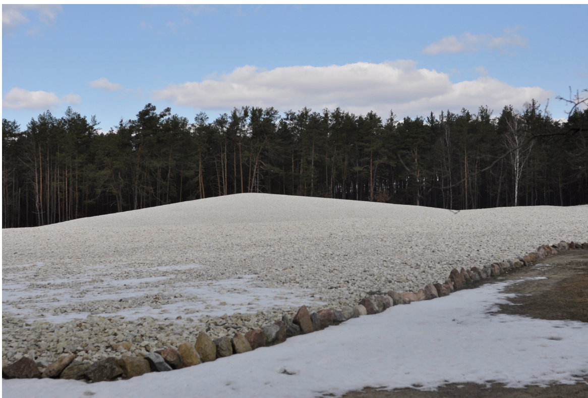
3. Muzeum i Miejsce Pamięci w Sobiborze, miejsce masowych mogił