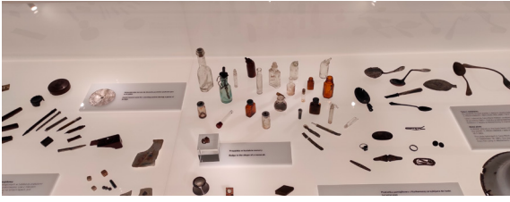
8. Muzeum i Miejsce Pamięci w Sobiborze, przedmioty w gablocie stałej ekspozycji

8. Museum and Memorial Site in Sobibór, objects in the display case of the permanent exhibition