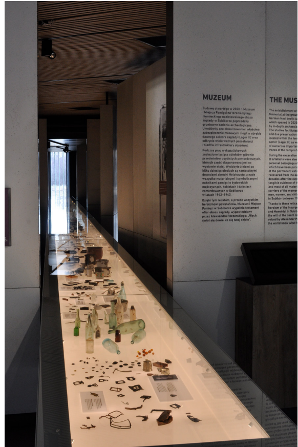
7. Muzeum i Miejsce Pamięci w Sobiborze, główna gablota stałej ekspozycji

We wnętrzu najważniejszą rolę edukacyjną spełnia wspomniana stała wystawa, prezentująca dzieje obozu w Sobiborze w szerszej perspektywie historycznej. Wystarczająco zabezpieczona zaplecze dydaktyczne, dostarczając w sposób zbilansowany najważniejszych informacji. Odwiedzający dowiadyuje się jak wyglądała organizacja i infrastruktura przemysłu zagłady, ale przede wszystkim odkrywa mikrohistorie zawarte w prezentowanych relacjach ocalałych i należących do ofiar osobistych przedmiotach. Osią ekspozycji projektanci uczynili poziomą przeszkoloną gablotę o długości 25 m, przebiegającą przez całą salę wystawową. Jasne, intensywnie podświetlone