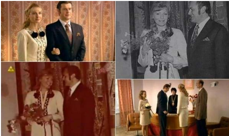
Zdj. 13: Zdjęcia ze ślubu Anny German i stopklatki z serialu „Anna German”

b) Stopklatka ukryta w narracji – pojawiają się znane w kulturze sytuacje znane z relacji reporterskich, telewizyjnych, fotograficznych, które funkcjonują w świadomości widzów i są odczytywane jako ukryte stopklatki z odtwarzanej w filmie rzeczywistości. Nie tylko możemy uchwycić poprzez stopklatkę portret postaci, ale wydarzenie, w którym uczestniczył. Zestawione poniżej przykłady fotografii i filmowych stopklatek doskonale ukazują, jak złudne wydaje się poczucie prawdziwości przedstawianych na nich wydarzeń. Jednolitość stylistyczna fotografii i stopklatek powoduje, że filmowe kadry mogłyby zastąpić autentyczne fotografie prawdziwych wydarzeń.