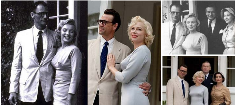
Zdj.16: Zdjęcia Marlin Monroe i stopklatka z filmu „Moje życie z Marlin”

c) stopklatka kulturowa – pojawianie się na ekranie znanych dzieł sztuki czy zabytków wydaje się rzeczą oczywistą. W tym kontekście stopklatka jest elementem kulturowej pamięci, która, w różnym stopniu świadomości, powoduje u widza odkrywanie tożsamości kulturowej. Widoczne jest to w inspiracjach filmowych wykorzystujących za temat swoich dzieł malarstwo 4 . Jednym z najbardziej malarskich twórców filmowych w Polsce jest Andrzej Wajda 5 .