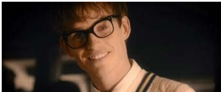
Zdj. 24: Stopklatka z „Teorii wszystkiego” reż. James Marsh

b) stopklatka jako moment zwrotu akcji – stopklatka bywa również elementem dramaturgii narracji filmowej. Nie tylko zawiesza czy kończy akcję i portretuje postaci, ale jest wykorzystywany do zmiany akcji i odwrócenia opowieści filmowej. Ciekawą kumulacją takich zabiegów jest film „Biegnij Lola, biegnij” w reżyserii Toma Tykwera. Konwencja scenariusza polega na wielokrotnym opowiadaniu tego samego wydarzenia z odmiennym zakończeniem. Każda kolejna próba pokazania historii bohaterów zaczyna się od stopklatki, zatrzymania akcji i rozpoczęcia nowej wersji wydarzeń. Dodatkowo elementy stopklatki są wykorzystane do ukazania upływu czasu i pokazania dalszej historii bohaterów poprzez kilka stopklatek kolejnych ujęć z życia bohatera.