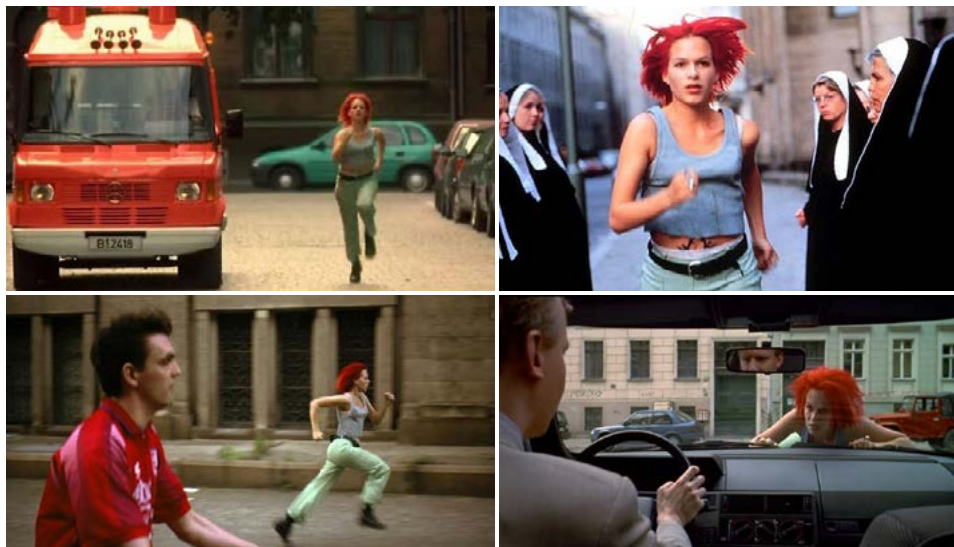
Zdj. 25: Stopklatki z „Biegnij Lola, biegnij” reż. T. Tykwer

b) stopklatka jako moment zwrotu akcji – stopklatka bywa również elementem dramaturgii narracji filmowej. Nie tylko zawiesza czy kończy akcję i portretuje postaci, ale jest wykorzystywany do zmiany akcji i odwrócenia opowieści filmowej. Ciekawą kumulacją takich zabiegów jest film „Biegnij Lola, biegnij” w reżyserii Toma Tykwera. Konwencja scenariusza polega na wielokrotnym opowiadaniu tego samego wydarzenia z odmiennym zakończeniem. Każda kolejna próba pokazania historii bohaterów zaczyna się od stopklatki, zatrzymania akcji i rozpoczęcia nowej wersji wydarzeń. Dodatkowo elementy stopklatki są wykorzystane do ukazania upływu czasu i pokazania dalszej historii bohaterów poprzez kilka stopklatek kolejnych ujęć z życia bohatera.