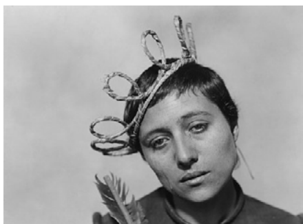
Zdj. 3.: Stopklatka z „Męczeństwa Joanny d'Arc” reż. C. T. Dreyer (1928)