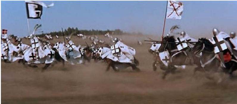
Zdj. 5.: Stopklatka z „Krzyżaków” reż. A. Ford (1960)