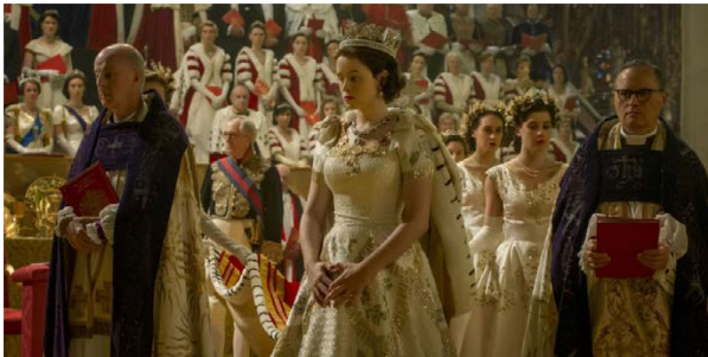
Zdj. 6.: Stopklatka z serialu „The Crown” reż. P. Morgan (2016)