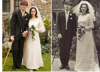
Zdj.15 Zdjęcia ze ślubu Stephen Hawkinga stopklatka z filmu „Teoria wszystkiego”