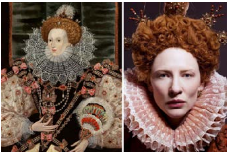
Zdj. 11: Portret Elżbiety I i stopklatka z filmu „Elizabeth”