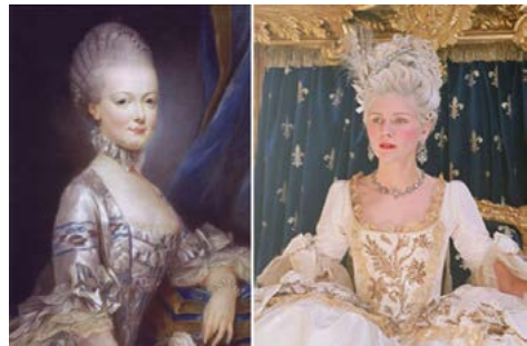
Zdj. 12: Portret Marii Antoniny i stopklatka z filmu „Marie Antoinette”