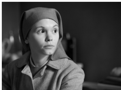
Zdj. 2.: Stopklatka z „Idy” reż. P. Pawlikowski (2013)