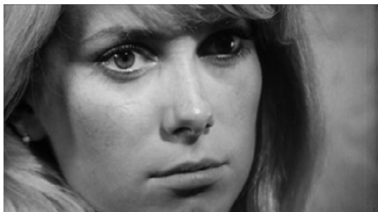
Zdj. 1.: Stopklatka z „Wstrętu” reż. R. Polański (1965)

zatrzymany podczas projekcji, często w konkretnym celu artystycznym. Cele te wyznaczone są przez styl filmowego opowiadania, wyrażony w gatunku dzieła filmowego, wykorzystanej muzyki czy sposobu operatorskiego fotografowania. Stopklatka znana jest jako zatrzymany kadr filmowy odczytywany powszechnie jako zdjęcie, a ściślej określając jako fotografia. Często bowiem ma charakter portretu zdjęciowego i postawione obok autentycznych zdjęć portretowych nie ukazuje widocznych różnic.