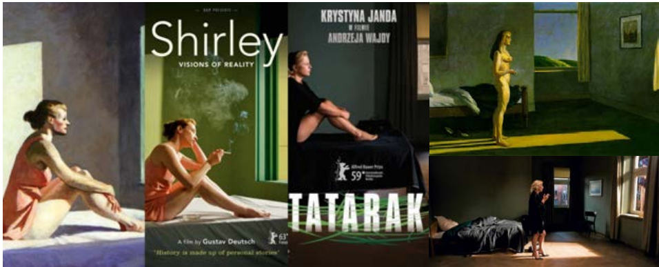
Zdj. 17: Malarstwo Edwarda Hoppera w inspiracji Andrzeja Wajdy „Tatarak” i Gustawa Deutscha „Shirley”

Te same funkcje mają wcześniej wymieniane portrety kalki. Na ekranie w jednej chwili widzimy nie tylko fragment filmu, kadr filmowy, ale obraz malarski. Często połączony z powolnym, minimalnym ruchem kamery lub kadrem statycznym, aby wprowadzić jak najbliższe ludzkiemu oku złudzenie oglądania plastycznego dzieła sztuki. Interesującym wydaje się połączenie przeciwności: linearności i statyczności takiego zabiegu filmowego. Z jednej strony bowiem mamy narrację ciągłą, filmową opowieść, następujące po sobie sytuacje dźwiękowe i obrazowe. Z drugiej natomiast zamrożenie chwili i stopklatkowe zatrzymanie na konkretnym, znanym ze sztuki kadrze. Dzięki temu oglądany obraz powoduje specyficzne doznania estetyczne widza, które wymykają się poza czysto filmowe czy muzealne.