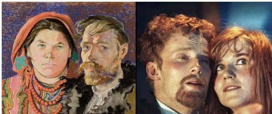
Zdj. 20: Stopklatka z „Wesela” na postawie dramatu St. Wyspiańskiego, reż. A. Wajda i obraz St. Wyspiańskiego”Portret z żoną”