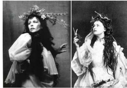
Zdj. 10.: zdjęcie Heleny Modrzejewskiej i stopklatka z filmu „Helena Modrzejewska”