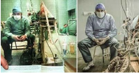
Zdj. 14: Zdjęcie Zbigniewa Religi i stopklatka z filmu „Bogowie”