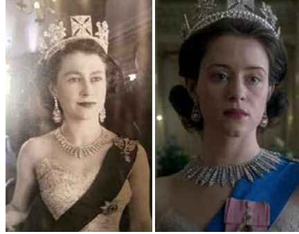
Zdj.8: Fotografia Elżbiety II i stopklatka z filmu „The Crown”