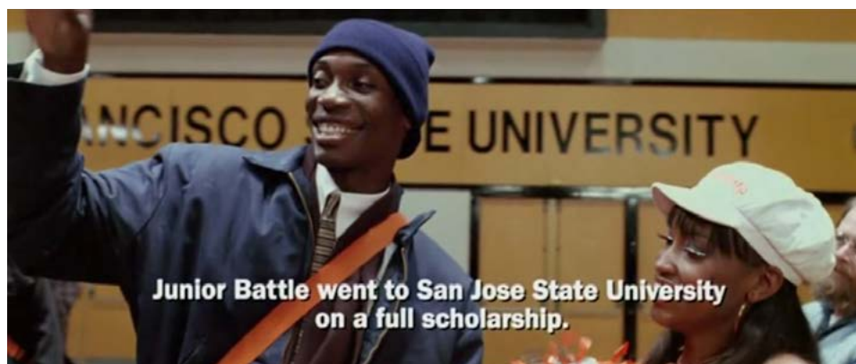
Zdj. 23: Stopklatka końcowa z filmu „Trener” reż. Thomas Carter

Odmiernym typem wymowy podobnego zabiegu jest zatrzymanie kadru kończące opowieść filmową pokazujący portrety bohaterów. Dzięki temu twórca filmu ma możliwość nie zmieniając wizualnego następstwa zdarzeń, opowiedzieć w skrócie dalsze losy bohaterów. Informacja przedstawiona jest jako tekst offowy (narratora lub bohatera) lub w postaci tekstu pisanego wyświetlanego na stopklatkach.