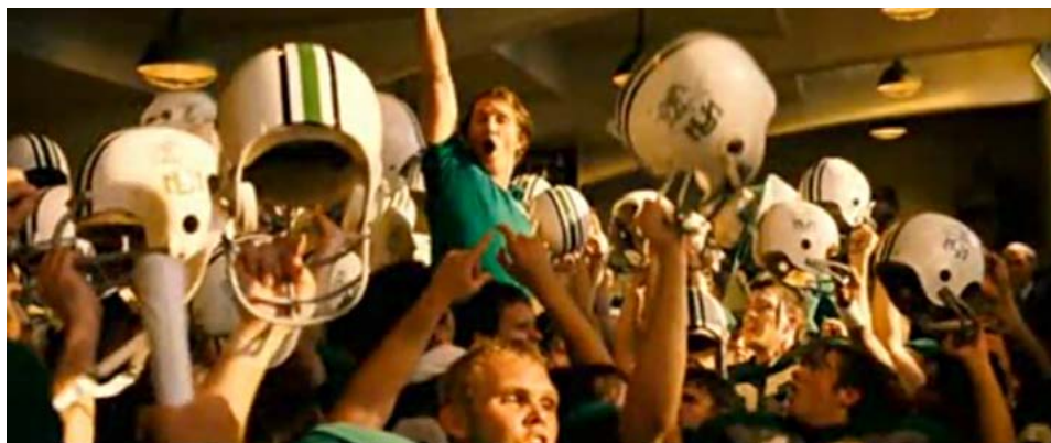
Zdj. 21: Stopklatka z filmu „Męski sport” reż. J.M. Nichol

Odmiernym typem wymowy podobnego zabiegu jest zatrzymanie kadru kończące opowieść filmową pokazujący portrety bohaterów. Dzięki temu twórca filmu ma możliwość nie zmieniając wizualnego następstwa zdarzeń, opowiedzieć w skrócie dalsze losy bohaterów. Informacja przedstawiona jest jako tekst offowy (narratora lub bohatera) lub w postaci tekstu pisanego wyświetlanego na stopklatkach.