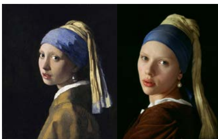
Zdj. 18: Stopklatka z „Dziewczyny z perłą” reż. P. Webbe i obraz o tym samym tytule Jana Vermeera

Te same funkcje mają wcześniej wymieniane portrety kalki. Na ekranie w jednej chwili widzimy nie tylko fragment filmu, kadr filmowy, ale obraz malarski. Często połączony z powolnym, minimalnym ruchem kamery lub kadrem statycznym, aby wprowadzić jak najbliższe ludzkiemu oku złudzenie oglądania plastycznego dzieła sztuki. Interesującym wydaje się połączenie przeciwności: linearności i statyczności takiego zabiegu filmowego. Z jednej strony bowiem mamy narrację ciągłą, filmową opowieść, następujące po sobie sytuacje dźwiękowe i obrazowe. Z drugiej natomiast zamrożenie chwili i stopklatkowe zatrzymanie na konkretnym, znanym ze sztuki kadrze. Dzięki temu oglądany obraz powoduje specyficzne doznania estetyczne widza, które wymykają się poza czysto filmowe czy muzealne.