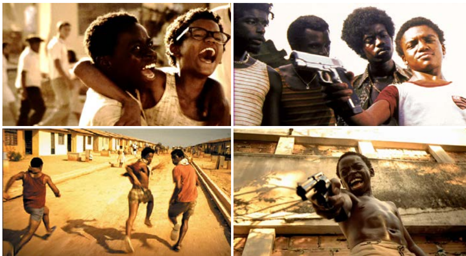
Zdj. 22: Stopklatki z filmu „Miasto Boga” w funkcji asynchronii wizualno-dźwiękowej

e) funkcja satyryczna stopklatki – jak zauważa Jerzy Płażewski, „zatrzymanie ruchu, wywołuje (...) wrażenie groteskowe, sprzeczne czasem z intencją samego twórcy” 9 . Naturalny ruch narracji filmowej, przerwany przez uchwycenie określonej sytuacji lub portretu bohatera, może wzmacniać sytuację, którą autor chce wyeksponować. W filmie dokumentalnym „Berlin” archiwalny cytat filmowy z podskakującym Hitlerem, cieszącym się z porażki wroga, został zatrzymany. Dramatyzm sytuacji ukazujący groteskowe ruchy Hitlera poprzez stopklatkę ukazał niedwuznaczny efekt satyryczny.