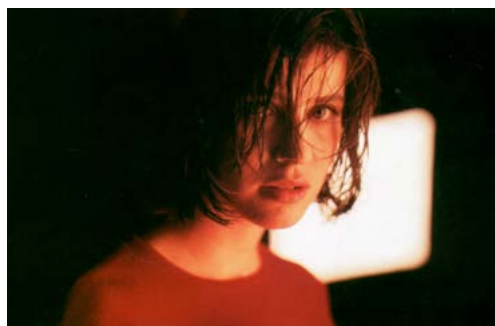
Zdj. 4.: Stopklatka z „Czerwonego” reż. K. Kieślowski

Stopklatka może być również odczytywana jako zdjęcie reportażowe. Fragment akcji filmowej zatrzymany na ekranie powoduje, że obraz staje się wycinkiem pokazywanej rzeczywistości. Reporterski świat fotografii opiera się na autentycznych wydarzeniach i postaciach. Filmowe ujęcie rzeczywistości często pokazuje jedynie wyobrażenie rzeczywistości lub twórcze odtworzenie dawnych wydarzeń. Można zatem odnaleźć stopklatkowe zdjęcia wojenne, społeczne czy historyczne.