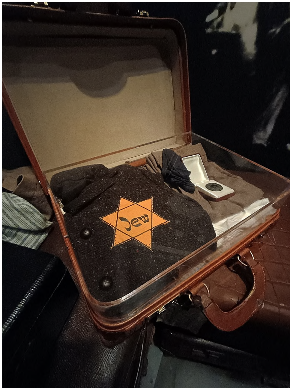
Fot. 5. Żółta gwiazda. Daniel's Story.