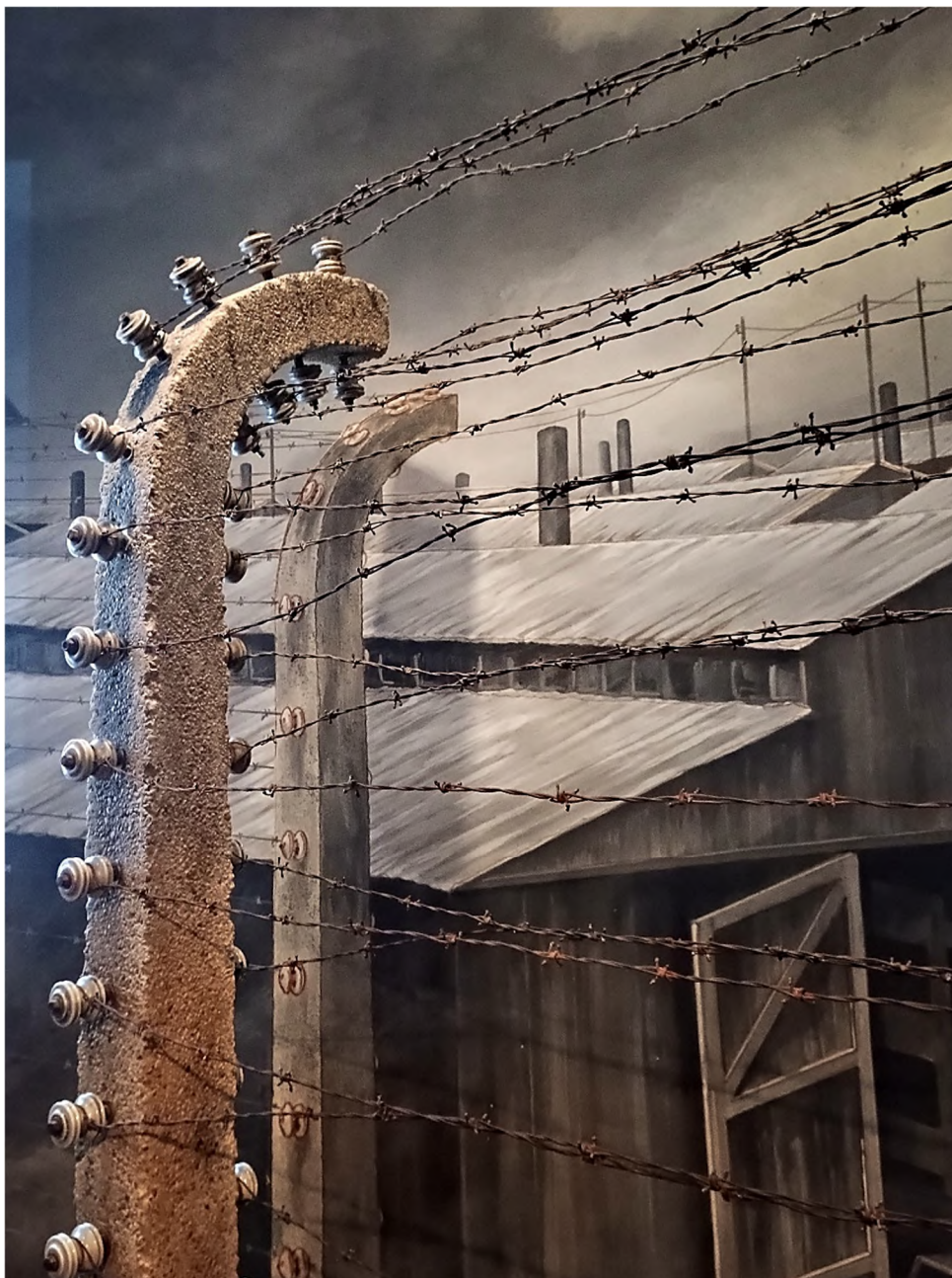
Fot. 6. Za drutami Auschwitz . Daniel's Story – USHMM.