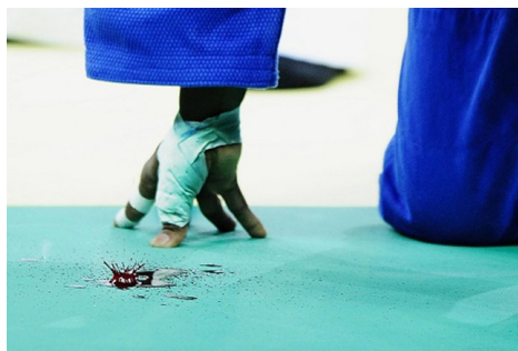
Zdj. 12. https://www.worldpressphoto.org/collection/photo/2009/sports/wu-xiaoling, dostęp: 18.03.2017; first prize sigles w kategorii Sports Feature w WPP 2009