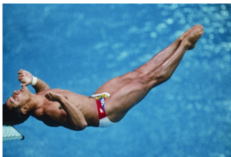
Zdj. 13. https://www.worldpressphoto.org/collection/photo/1989/sports/brian-smith, dostęp: 18.03.2017; first prize singles w kategorii Sports w WPP 1989

Jeszcze jedno znamienne zestawienie zdjęć mistrzów, których nazwiska zapisały się w historii sportu: