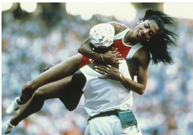
Zdj. 3. https://www.worldpressphoto.org/collection/photo/1989/sports/lutz-bongarts, dostęp: 18.03.2017; second prize singles w kategorii Sports w WPP 1989

Zupełnie inne interpretacje można powiązać z dwoma poniższymi kadrami: