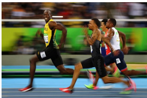
Zdj. 14. https://www.worldpressphoto.org/collection/photo/2017/sports/kai-oliver-pfaffenbach, dostęp: 18.03.2017; third prize singles w kategorii Sports w WPP 2017