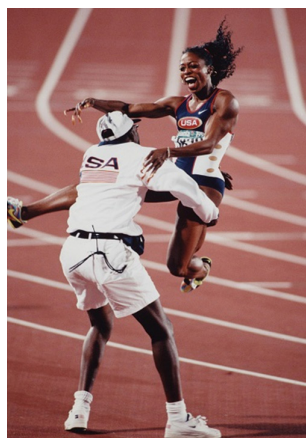
Zdj. 4. https://www.worldpressphoto.org/collection/photo/1997/sports/stan-behal, dostęp: 18.03.2017; second prize singles w kategorii Sports w WPP 1997; Kanada.

Na obu fotogramach uchwycony został moment radości po wygranej biegu, dzielony na pierwszym z mężem, na drugim z trenerem. Na zdj. 3 widać bohaterkę Igrzysk Olimpijskich w Seulu, Florence Griffith-Joyner, unoszoną przez męża po zdobyciu przez nią złotego medalu w biegu na 200 metrów i ustanowieniu rekordu świata na tym dystansie. Fokus skierowany na postacie rozmył tło, sprawiając, że mamy wrażenie obcowania z bardzo intymnym momentem dzielonego szczęścia. Przymknięte oczy Griffith-Joyner i spokojny uśmiech nadają jej twarzy wyraz błogości. Mąż z łatwością unosi jej smukłe ciało, co przydaje scenie na równi dynamiki, jak i symboliki połączenia pierwiastka kobiecego i męskiego w idealną całość. Muskularne ramiona biegaczki, obejmujące szyję