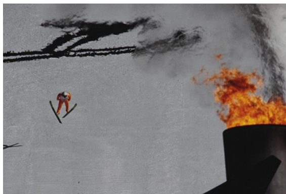
Zdj. 1. https://www.worldpressphoto.org/collection/photo/1995/sports/bill-frakes ; dostęp: 18.03.2017; second prize singles w kategorii Sports w WPP 1995

riery sportowej Adama Małysza, ale konkurs WPP ma zasięg światowy). Faktem pozostaje, że zimowe dyscypliny olimpijskie są reprezentowane nader skromnie, a oba zdjęcia pokazują skoczków narciarskich.