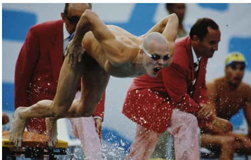
Zdj. 5. https://www.worldpressphoto.org/collection/photo/1993/sports/michael-kunkel, dostęp: 18.03.2017; first prize singles w kategorii Sports w WPP 1993

Dla porównania warto teraz zestawić ze sobą nagrodzone zdjęcia, których bohaterami są sportsmeni: