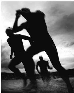
Zdj. 15. https://www.worldpressphoto.org/collection/photo/2005/sports/jonathan-ferrey, dostęp: 18.03.2017; third prize singles w kategorii Sports Action w WPP 2005

Wśród zgromadzonych fotografii z badanego okresu są jeszcze kadry z wyraźnymi brakami technicznymi, niedoświetlone czy ziarniste, ale chwytające w niepowtarzalny sposób przełomowy moment w historii sportu ostatnich lat czy emocje sportsmenów: