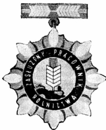
Rycina 4. Strona licowa odznaki honorowej „Zasłużony Pracownik Rolnictwa”

Źródło: Zarządzenie Ministra Rolnictwa z 27 października 1970 r. w sprawie ustalenia regulaminu odznaki „Zasłużony Pracownik Rolnictwa”, M.P. 1970 nr 37 poz. 280.