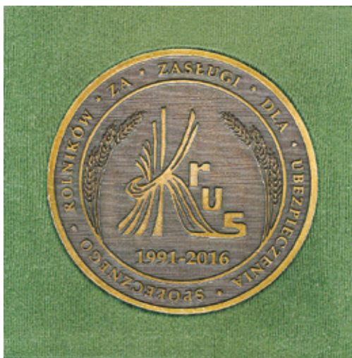
Rycina 3. Strona licowa medalu jubileuszowego „Za Zasługi dla Ubezpieczenia Społecznego Rolników. KRUS 1991–2016”