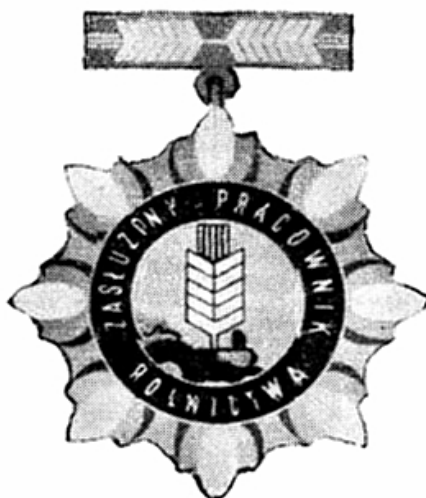
Figure 4. The front side of the badge of honor “Meritorious Agriculture Worker”

Source: Ordinance of the Minister of Agriculture of October 27, 1970, regarding the regulation of the badge of “Meritorious for Agriculture”, M.P. 1970 No. 37 item 280.