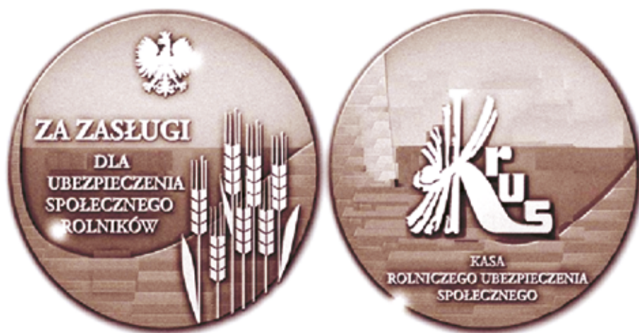
Figure 2. Obverse and reverse of the medal “For services for farmers’ social insurance”