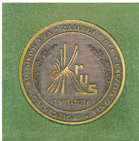
Figure 3. The front side of the jubilee medal “For Merits for Farmers’ Social Insurance. KRUS 1991–2016”