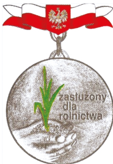
Figure 5. Front side of the honorary badge “Meritorious for Agriculture”