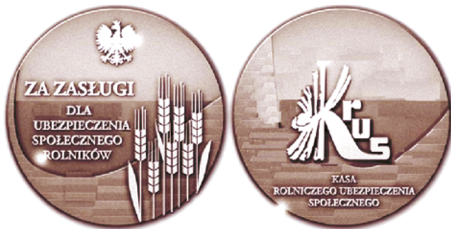
Rycina 2. Awers i rewers medalu „Za zasługi dla ubezpieczenia społecznego rolników”