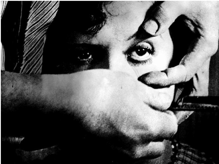
Tableau 2. Le cadre d' Un chien andalou

À cet égard l'œil pourrait être rapproché du tranchant , dont l'aspect provoque également des réactions aiguës et contradictoires (Teixeira, 2011 : 34). Sur cette image très forte, l'œil se rapproche d'un œuf coupé, liquidé. Plus tard, la protagoniste s' imagine qu'elle est nue à côté d'un homme qui, à son tour, a les yeux renversés au point que nous ne voyions que les blancs. Comme tel, il est