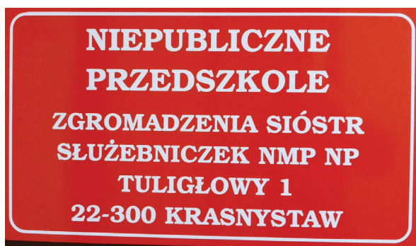
Zdjęcie nr 5: Niepubliczne przedszkole

nie i opiekę licznemu rodzeństwu. Zapewniają dzieciom kształcenie, wyrównywanie opóźnień rozwojowych i szkolnych. [...] Na potrzeby dzieci i młodzieży placówka zatrudnia pedagoga, psychologa, pracownika socjalnego, lekarza pediatrę, pielęgniarki, wychowawców. Kadra pedagogiczna pracująca z dziećmi posiada odpowiednie przygotowanie i kwalifikacje” 35 . Od 1 września 2015 roku przy domu prowadzone jest Niepubliczne Przedszkole Zgromadzenia Sióstr Służebniczek w Tuligłowych. Uczęszczają tam dzieci z placówki oraz z okolicznych miejscowości w wieku od 2,5 do 5 roku życia (zdjęcie nr 5).