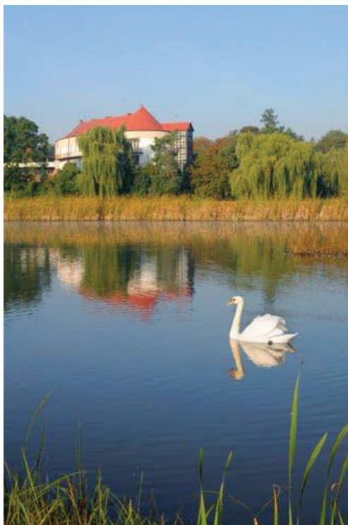
Zdjęcie nr 3: Widok na „Nasz Dom”

tensywną działalność na rzecz dzieci i potrzebujących. Kiedy w Polsce zakazano wykładania religii w szkołach siostry podejmowały działalność katechizacji dzieci i młodzieży w salach przyparafialnych 25 .