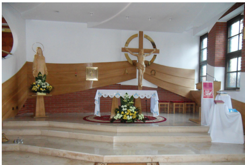
Zdjęcie nr 7: Kaplica w „Naszym Domu”

Są tam także miejsca przeznaczone na naukę, zabawę („bawialka”), a także aneks kuchenny z wyposażeniem i łazienka. Szczególnym miejscem w domu jest kaplica, gdzie codziennie rano jest odprawiana Msza Święta, w niedzielę wszystkie dzieci na nią chodzą. Mogą w niej uczestniczyć również mieszkańcy okolicznych wsi. Przed domem natomiast znajdują się place zabaw, boiska, ogród z warzywami oraz sad owocowy, z którego korzystają mieszkańcy.