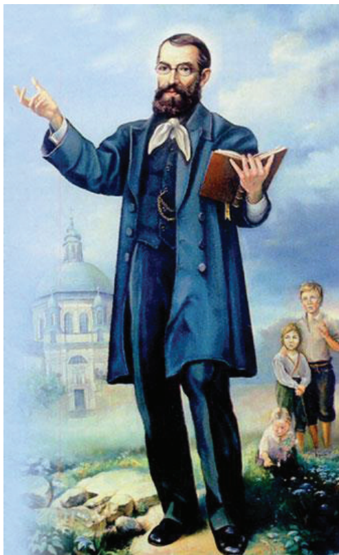
Zdjęcie nr 1: Bł. Edmund Bojanowski

Kiedy miał cztery 2 , pięć lat ciężko zachorował, prawdopodobnie było to zapalenie płuc. Dzięki wytrwałości i modlitwie matki mały Edmund został cudownie uzdrowiony. Cud uzdrowienia jego rodzice zawdzięczali Matce Bożej Świętogórskiej, która znajdowała się w sanktuarium księży filipinów w Gostyniu 3 . Zdjęcie nr 2 przedsta-