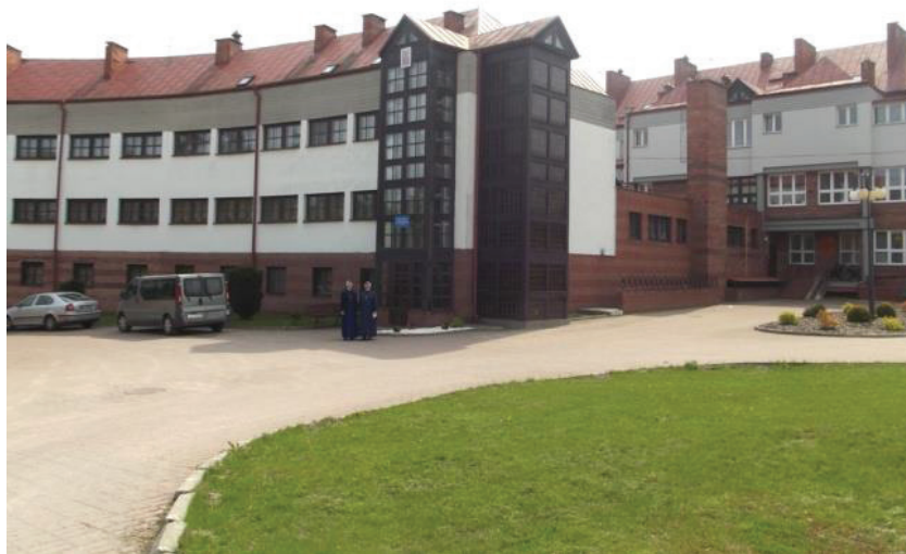
Zdjęcie nr 4: „Nasz Dom”

drugi dom, ale i szkoła – jedyny ośrodek tego typu w części wschodniej Polski, istniejący do końca 2004 roku. W późniejszym czasie został on przekształcony w Niepubliczny Zespół Placówek Opiekuńczo-Wychowawczych, który sprawuje opiekę nad noworodkami, dziećmi w wieku przedszkolnym, szkolnym, gimnazjalnym oraz licealnym do 18. roku życia 31 . „Od października 2010 roku zmieniona została nazwa placówki – »Nasz Dom« im. Edmunda Bojanowskiego w Tuligłowach. W tym też roku na wniosek Zgromadzenia Sióstr Służebniczek placówka za zgodą wojewody lubelskiego otrzymała zezwolenie na prowadzenie działalności na stałe. »Nasz Dom« dysponuje czterdziestoma czterema miejscami. Placówka jakkolwiek przejściowo stanowi dla dzieci dom, w którym jedne przygotowują się do samodzielnego życia, inne oczekują na środowisko zastępcze lub adopcje” 32 .