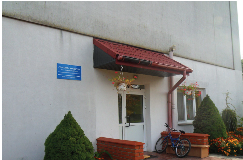
Zdjęcie nr 6: Placówka rodzinna s. Longiny

Wszystkie dzieci przebywające w „Naszem Domu” są jedną wielką rodziną, są dla siebie rodzeństwem. W jednym domu zamieszkują dzieci z różnych rejonów, zdrowe, ale również z niepełnosprawnością lub jakąś chorobą. Nie ma tu żadnej selekcji dzieci, jeśli sąd skieruje do placówki dane dziecko, natychmiast znajduje ono tutaj schronienie, ale nie chodzi tylko o dach nad głową czy posiłek, ale także miłość i akceptację, co pozwala im na nowe życie, nowy start. Siostry wraz z wychowawcami dbają również o wykształcenie dzieci, o rozwój ich zainteresowań, a nie tylko o warunki bytowe, które są dosyć wysokie. Jeśli któreś z dzieci zachoruje, natychmiast jest zgłaszane do odpowiedniego specjalisty, by jak najszybciej powrócić do zdrowia.