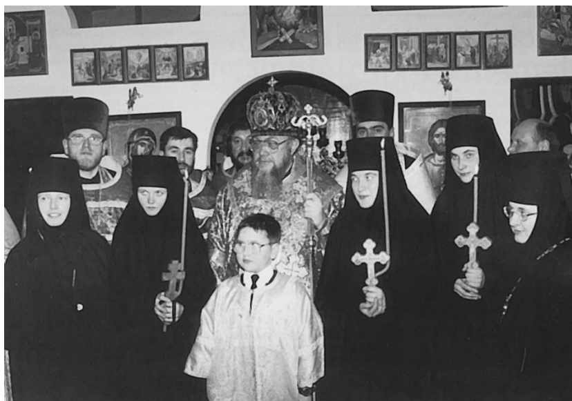
Fot. 9. Postrzyżyny mnisze w Monasterze w Dojlidach. 20 marca 1999.