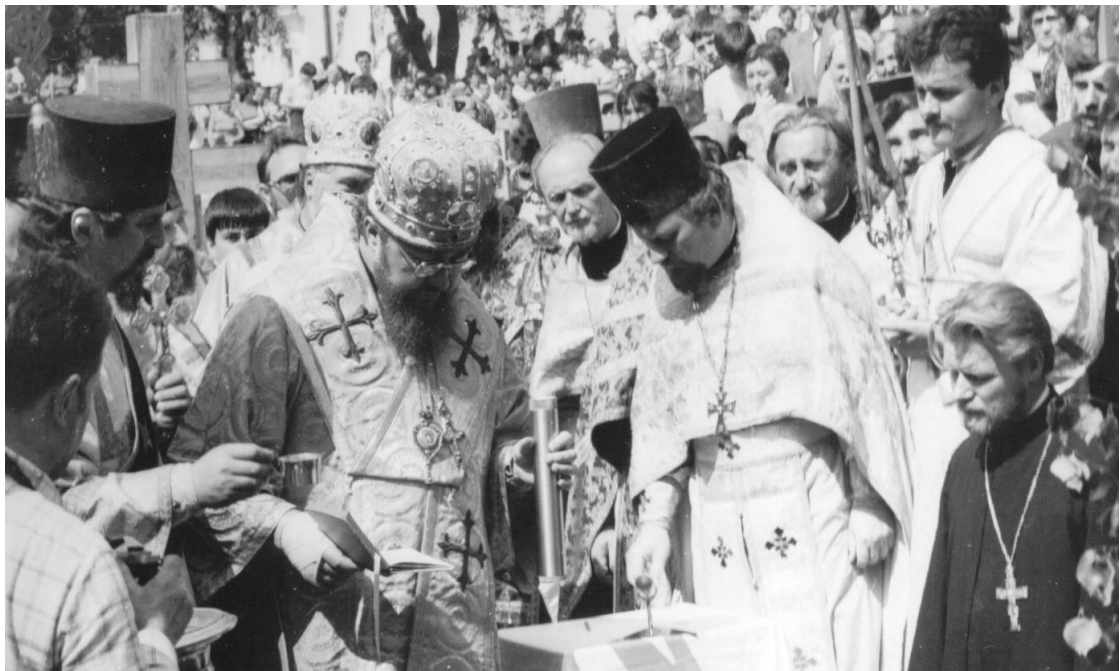
Fot. 6. Położenie kamienia węgielnego pod odbudowę cerkwi Zwiastowania NMP w monasterze w Supraślu. 3 czerwca 1984. Archiwum Warszawskiej Metropolii Prawosławnej.