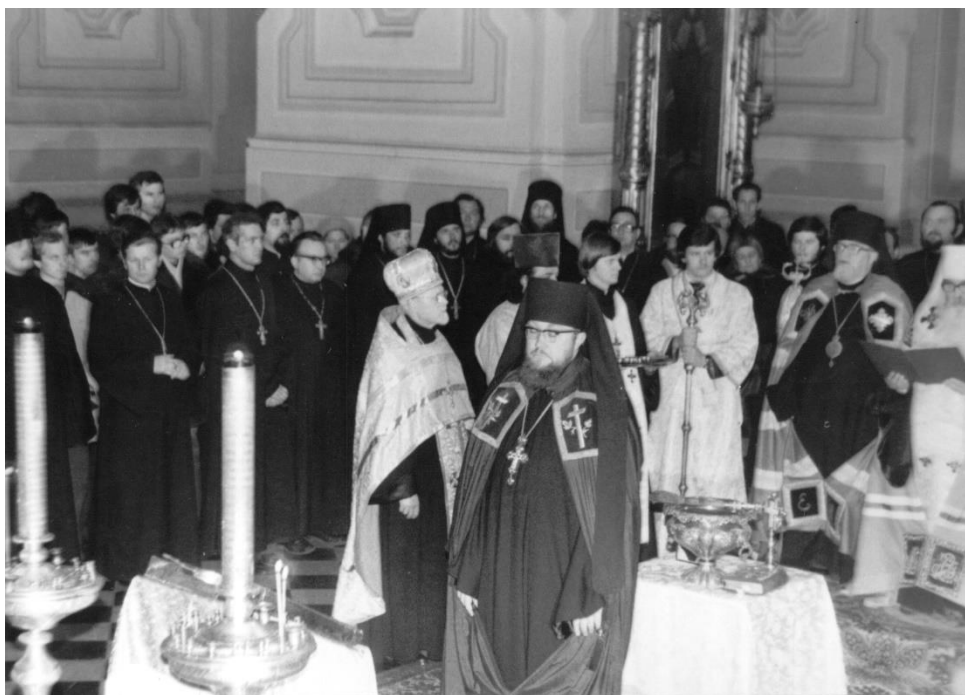
Fot. 3. Chirotonia biskupia 25 listopada 1979.