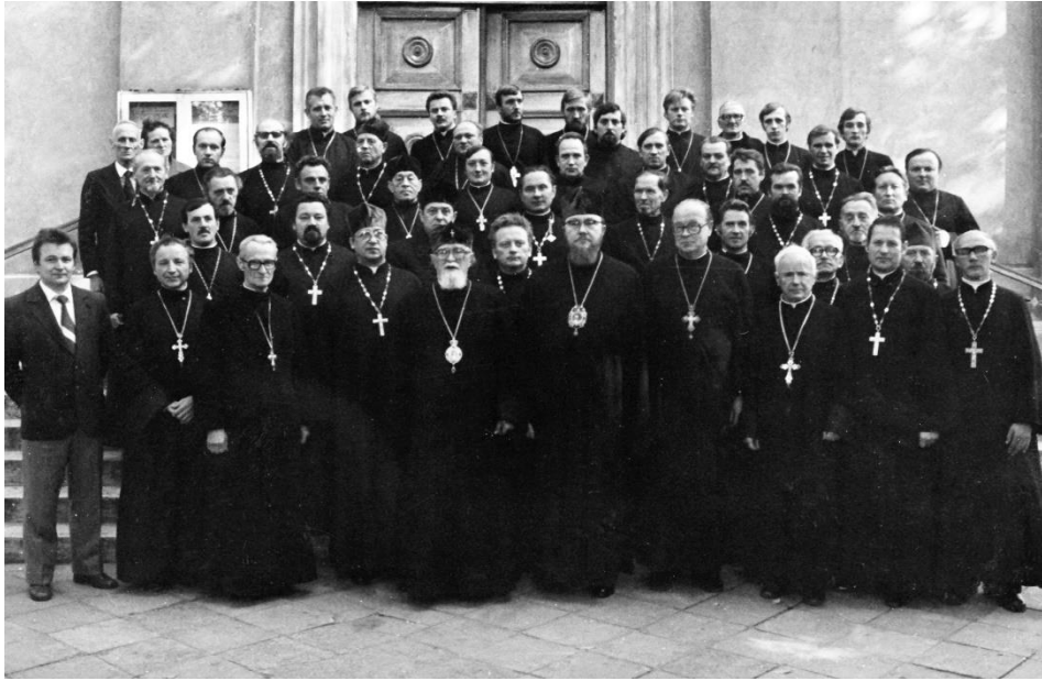
Fot. 5. Konferencja diecezjalna w Białymstoku. Katedra św. Mikołaja 24 maja 1982.