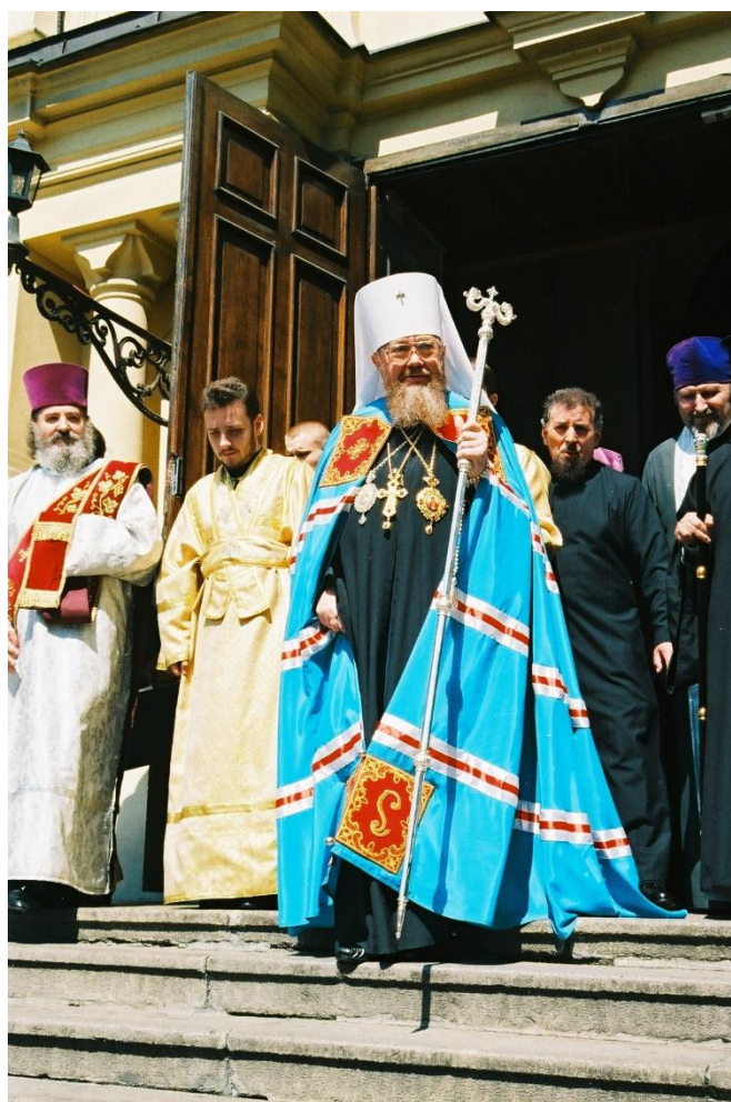
Fot. 10. Intronizacja metropolity Sawy w Katedrze św. Marii Magdaleny w Warszawie. 12 maja 1998.