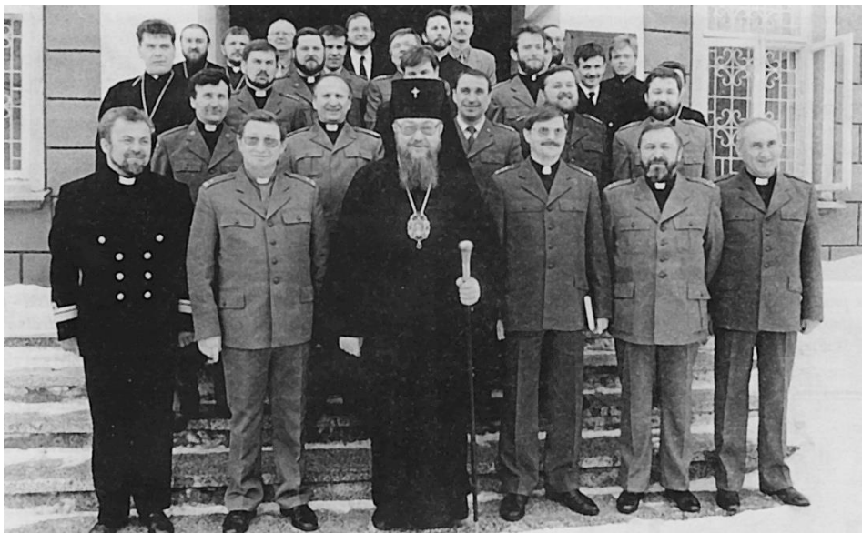
Fot. 8. Odprawa kapelanów Prawosławnego Ordynariatu Wojska Polskiego w Białymstoku. Rok 1996.