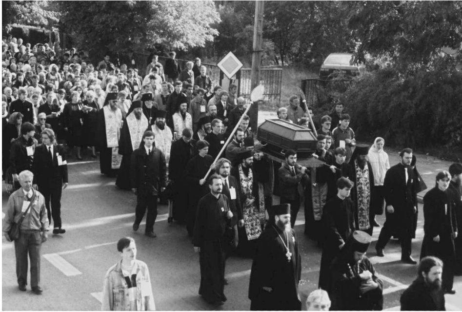
Fot. 7. Przeniesienie relikwii św. Gabriela z Grodna do Białegostoku. 21 września 1992. Archiwum Warszawskiej Metropolii Prawosławnej.