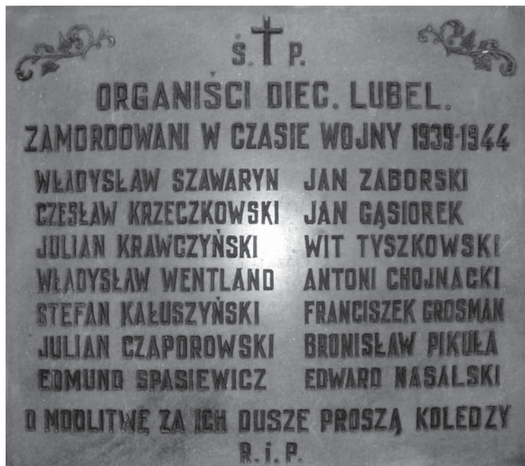
Fot. 4. Tablica ku czci zamordowanych organistów diecezji lubelskiej w kościele pw. Św. Ducha w Lublinie/

Photo 4. The plaque commemorating murdered organists of the Diocese of Lublin put up in the Church of the Holy Spirit in Lublin.