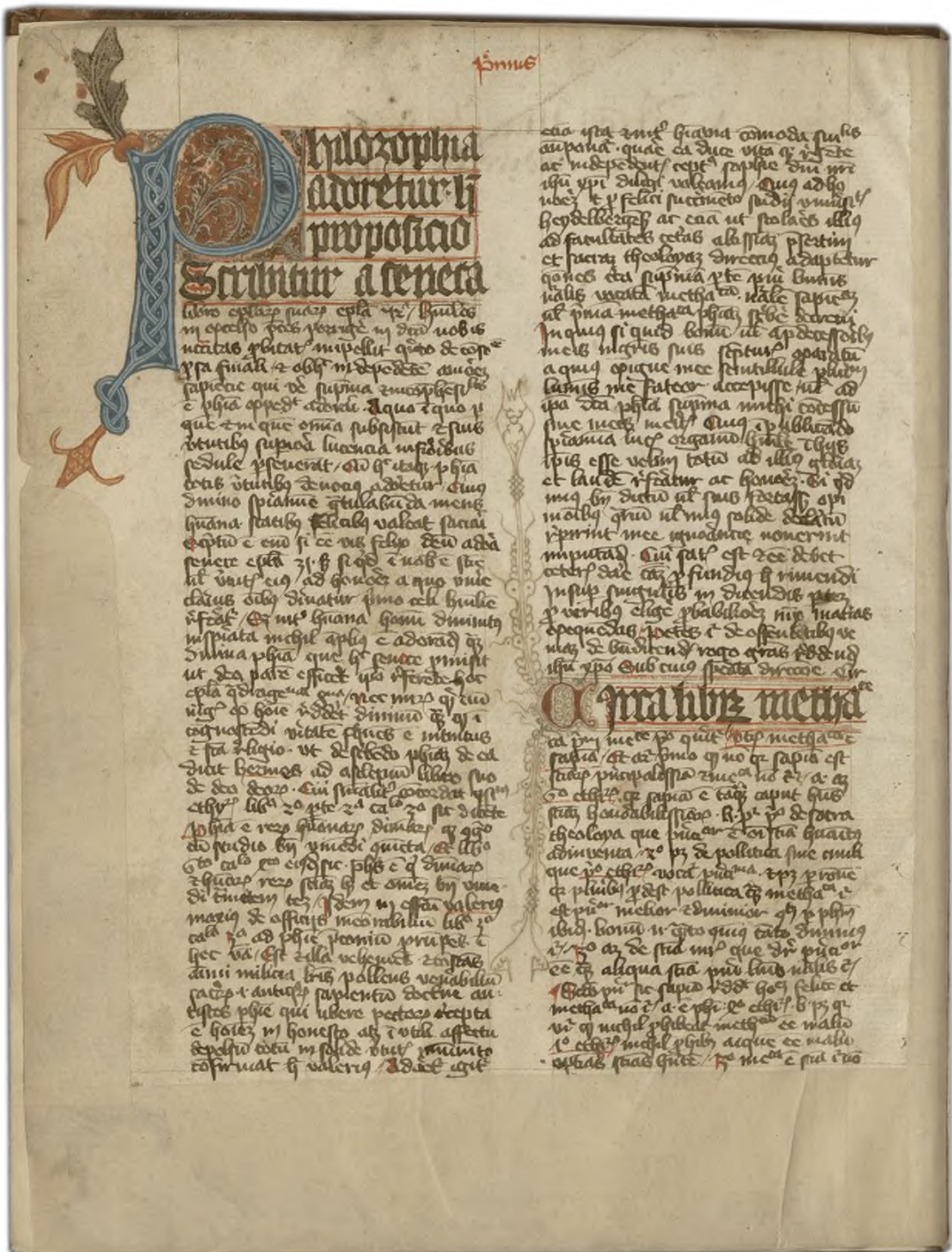
K 2 = Kraków, Biblioteka Jagiellońska, sgn. 709, f. 1v