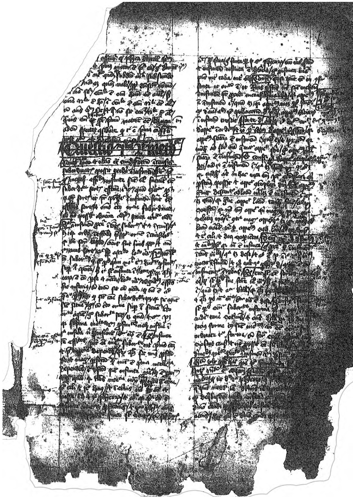
W 2 = Wien, Österreichische Nationalbibliothek, sgn. 5376, f. 1r