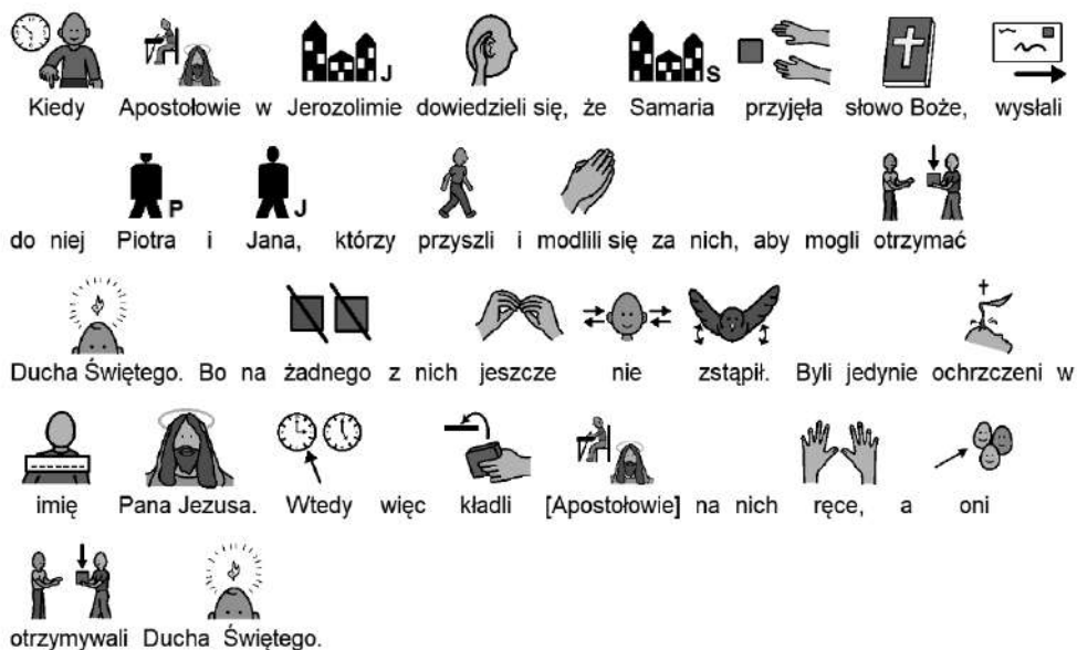
Tab. 1. Słowo Boże

Liturgia słowa odbywa się zgodnie z przepisami. Wszystkie czytania lub ich część można wziąć albo z mszy danego dnia, albo z tekstów przeznaczonych na bierzmowanie, zawartych w Lekcjonarzu (t. VII). Należy przygotować wszystkie części liturgii słowa, a następnie wprowadzić za pomocą AAC prezentację kandydatów. Także w krótkiej homilii biskup wyjaśnia teksty i w ten sposób wprowadza kandydatów, ich świadków i rodziców oraz całe zgromadzenie wiernych w głębsze zrozumienie misterium bierzmowania.