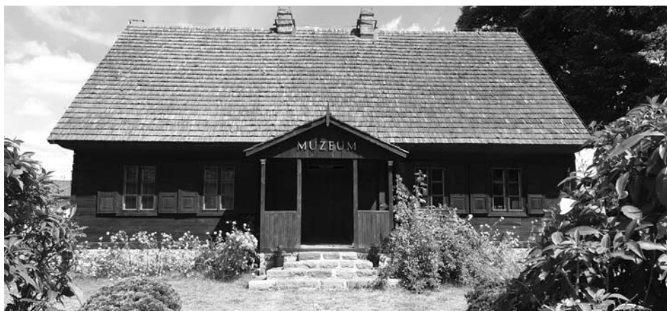
Fot. 2. Budynek Muzeum Lat Dziecięcych Prymasa Tysiąclecia Stefana Kardynała Wyszyńskiego w Zuzeli.