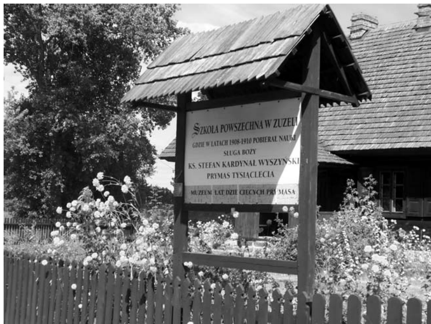
Fot. 1. Tablica informacyjna Muzeum Lat Dziecięcych Prymasa Tysiąclecia Stefana Kardynała Wyszyńskiego w Zuzeli.