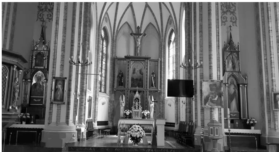
Fot. 9. Wnętrze kościoła parafialnego pw. Przemienienia Pańskiego w Zuzeli. Z prawej strony zdjęcia chrzcielnica, nad nią wizerunek kard. Stefana Wyszyńskiego. Z lewej strony obraz Matki Bożej Częstochowskiej, przed którym modliła się rodzina Wyszyńskich.