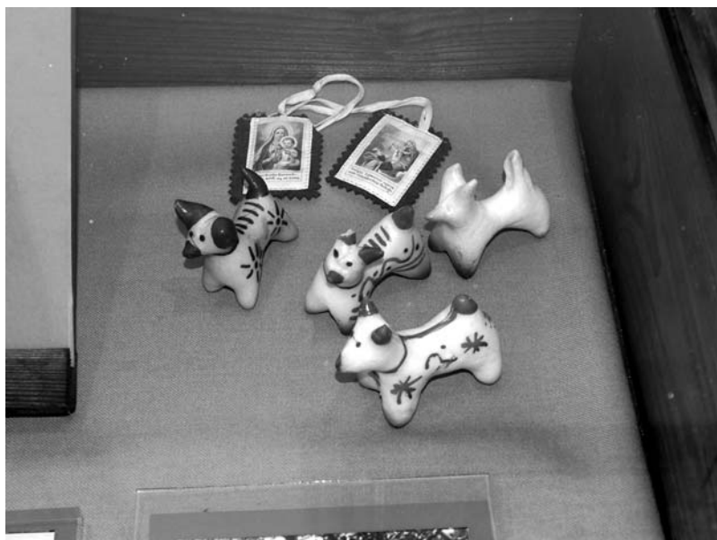
Fot. 6. Ekspozycja w sali szkolnej. Kozy prostyńskie, które z pielgrzymek do sanktuarium w Prostyni przynosili mieszkańcy Zuzeli.