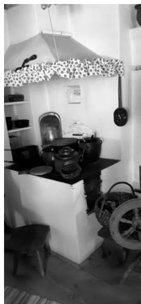
Fot. 8. Zrekonstruowana kuchnia rodziny Wyszyńskich w Muzeum Lat Dziecięcych Prymasa Tysiąclecia Stefana Kardynała Wyszyńskiego w Zuzeli.