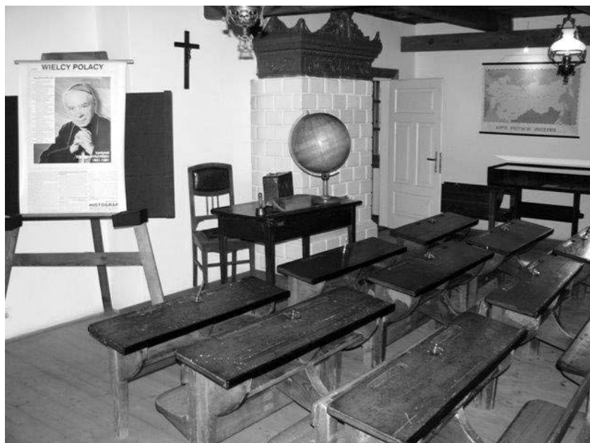
Fot. 3. Wnętrze sali szkolnej w Muzeum Lat Dziecięcych Prymasa Tysiąclecia Stefana Kardynała Wyszyńskiego w Zuzeli.