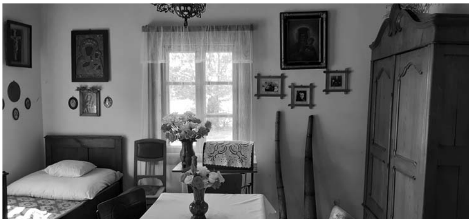
Fot. 7. Zrekonstruowany pokój rodziny Wyszyńskich w Muzeum Lat Dziecięcych Prymasa Tysiąclecia Stefana Kardynała Wyszyńskiego w Zuzeli.