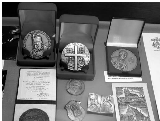
Fot. 4. Pamiątki w gablocie w sali szkolnej, w Muzeum Lat Dziecięcych Prymasa Tysiąclecia Stefana Kardynała Wyszyńskiego w Zuzeli.