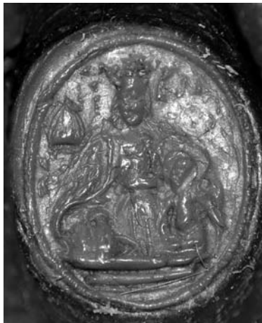
II. 2. Sygnet sufragana płockiego Michała z Raciąża. AP Toruń, Kościół NMP, sygn. 1.

Drugi z zajmujących nas typariuszy, używanych przez Michała z Raciąża, to sygnet 9 , o czym przekonuje nas formuła koroboracyjna noty wykonawczej z daty: Toruń, 4 lipca 1507 roku ( in cuius rei testimonium signetum nostrum presentibus est subappensum ) 10 . Został on przywieszony na pasku pergaminowym do pliki wcześniejszego, pochodzącego z daty: Rzym, 15 listopada 1475 roku, dokumentu odpustowego dla kaplicy pw. św. Barbary na Barbarce k. Torunia, wystawionego przez Angelusa biskupa Palestriny oraz kardynałów: Stefana św. Adriana, Ausiasza św. Witalisa i Jana Michała św. Michała. Użycie w tym przypadku sygnetu wydaje się być dość odosobnionym przypadkiem, co prawdopodobnie związane było z chwilowym(?) brakiem pieczęci mniejszej. Jego ochronę stanowi miseczka woskowa koloru brązowego, sama zaś pieczęć została odciśnięta w czerwonym wosku.