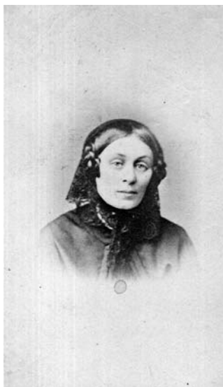
Il.4. Księżna Elżbieta z Działyńskich Czartoryska